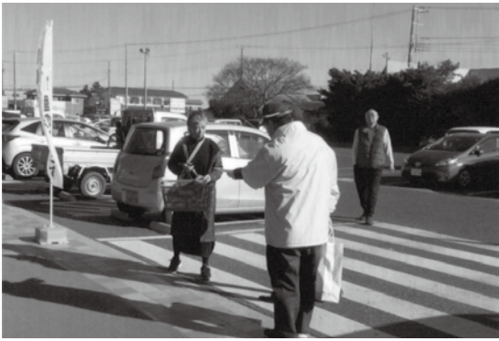
い す み