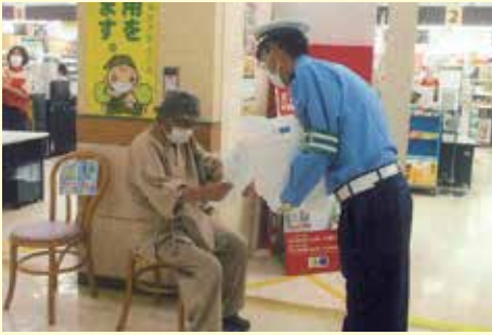
大多喜 おおたきショッピングプラザオリブでの交通安全キャンペーン