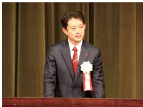
千葉県知事あいさつ