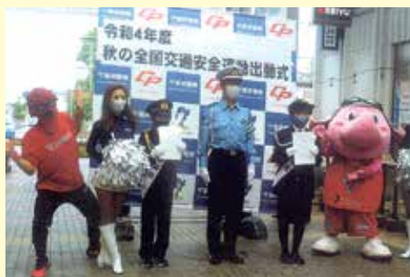
船橋東 J U J U 広場での交通安全運動出動式