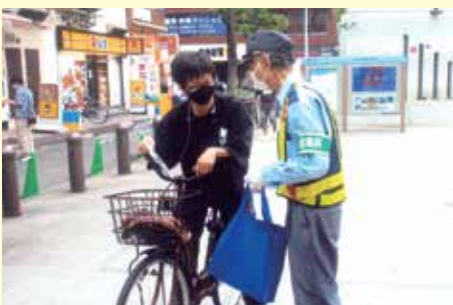
行徳 行徳駅前付近での交通安全キャンペーン