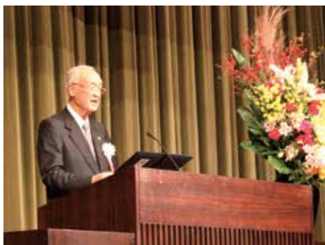
千葉県交通安全協会会長による大会宣言