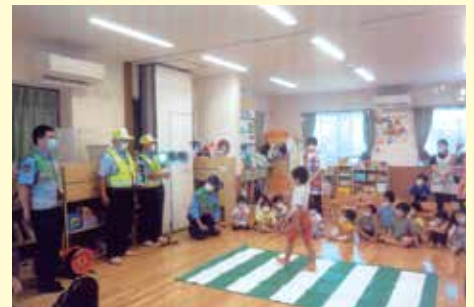
流山 流山こぼと保育園での交通安全教室