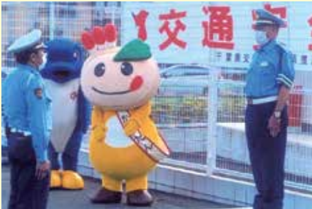
鎌ヶ谷 市役所での交通安全運動出動式