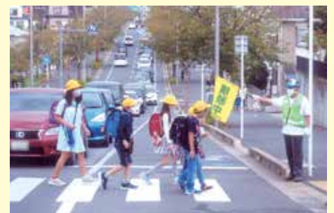
千葉南 誉田東小学校付近での保護誘導活動