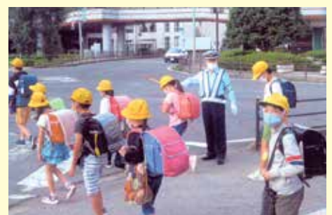
佐倉 ユーカリが丘駅前交差点での保護誘導活動