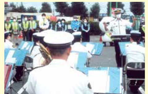
千葉東 しょいか〜ご千葉店での交通安全運動出動式