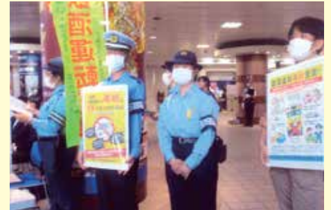
千葉中央 千葉そごう前での飲酒運転根絶キャンペーン