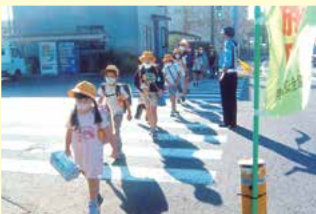
南総 鶴舞小学校付近交差点での保護誘導活動