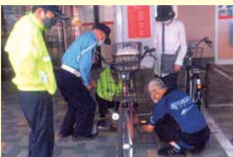
君津 アピタパワー君津店での自転車の無料点検及び啓発活動