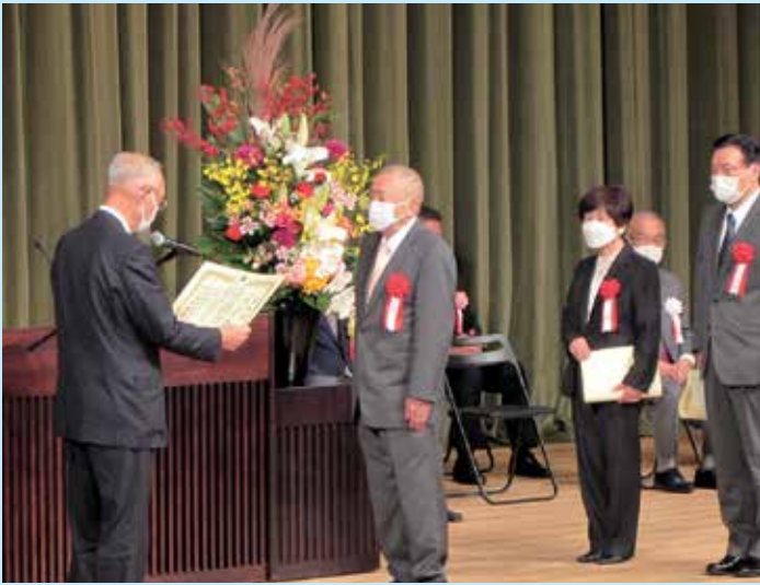
千葉県警察本部長・千葉県交通安全協会会長表彰