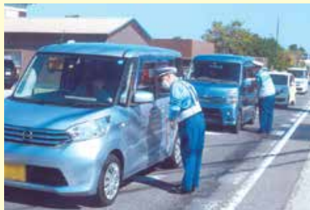
銚子 春日町交差点付近での交通安全キャンペーン