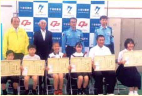
いすみ 警察署での交通安全ポスターコンクール表彰式