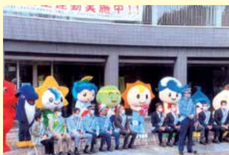
茂原 市役所での交通安全運動出動式