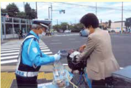
市川 富貴島小学校付近での交通安全キャンペーン