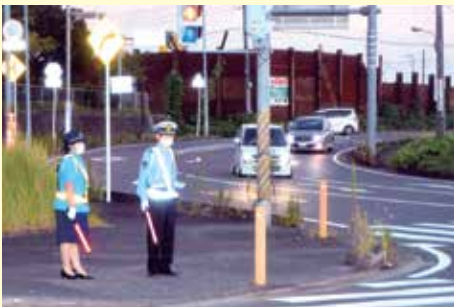
市原 磯ヶ谷交差点での薄暮時の街頭指導活動