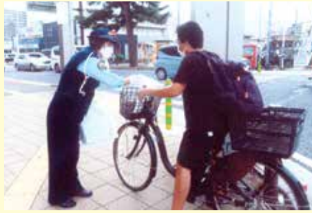
四街道 消防署付近での交通安全キャンペーン