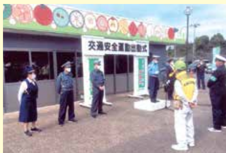
匝瑳 ふれあいパーク八日市場での交通安全キャンペーン