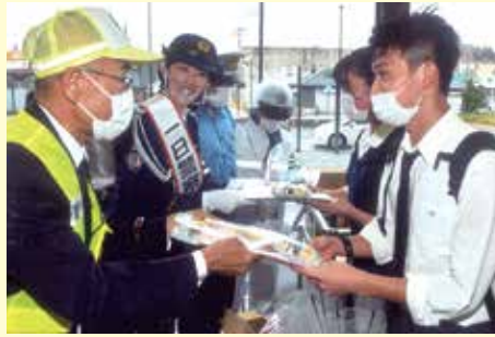
香取 佐原駅での一日警察署長参加による交通安全キャンペーン