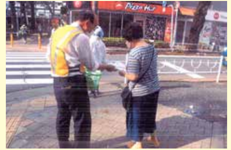
松戸東 西友常盤平店前での交通安全キャンペーン