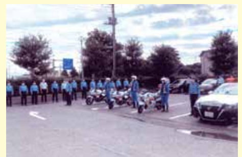
我孫子 警察署での交通安全運動出動式