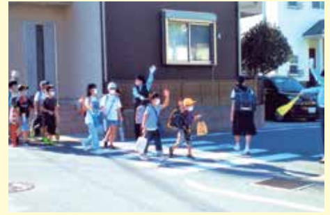
松戸 河原塚小学校付近での保護誘導活動