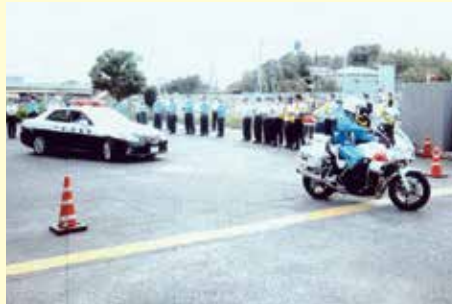
千葉北 警察署での交通安全運動出動式