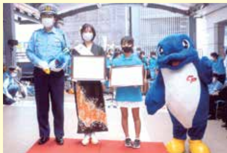
船橋 京成船橋駅接続デッキでの一日警察署長等による交通安全キャンペーン