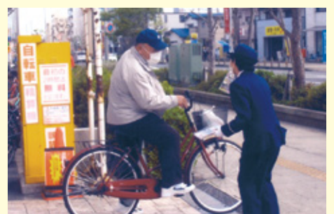
浦 安 ダイエー浦安駅前店前の交通安全キャンペーン