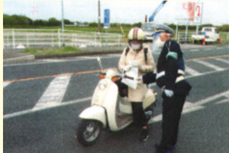
富津 市役所前での交通安全キャンペーン