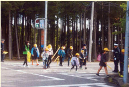
茂 原 関小学校入口交差点での保護・誘導活動