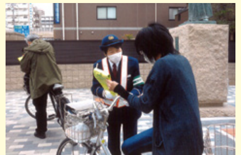
市 川 市役所前での交通安全キャンペーン