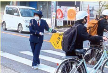
一 宮 玉前神社入口交差点での保護・誘導活動