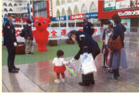
柏 ビックカメラ柏店前での交通安全キャンペーン