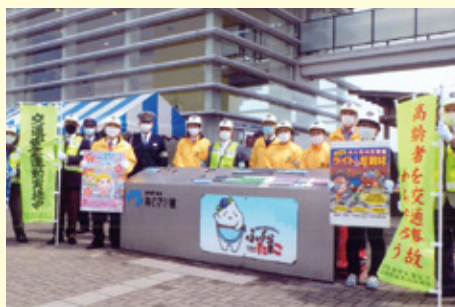
多 古 道の駅多古あじさい館での交通安全キャンペーン