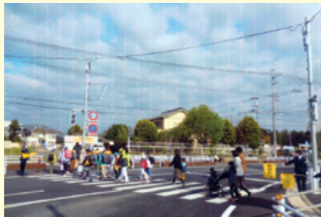
流 山 おおぐろの森小学校付近交差点での保護・誘導活動