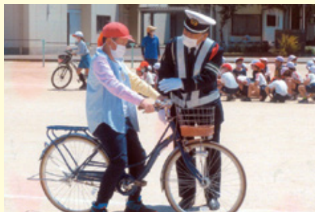
佐 倉 西志津小学校での交通安全教室