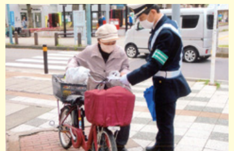
行 徳 行徳駅前での交通安全キャンペーン