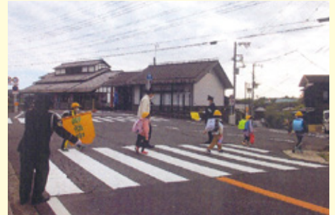
大多喜 大多喜駅前での保護・誘導活動