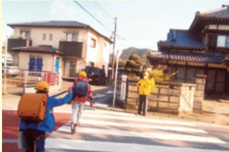
鴨川 上人塚交差点での保護・誘導活動