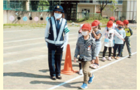
千葉東 白井小学校での交通安全教室