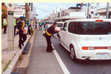
銚 子 西芝交差点での交通安全キャンペーン