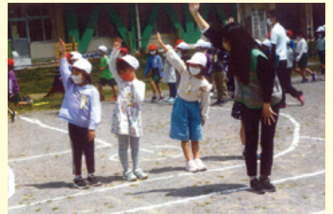
船橋東 豊富小学校での交通安全教室