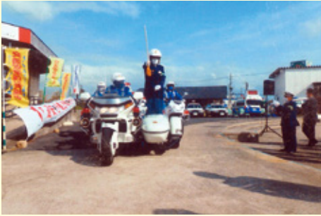
東 金 道の駅みのりの郷東金での交通安全運動出動式