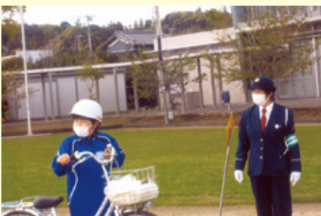
いすみ 岬中学校での交通安全教室