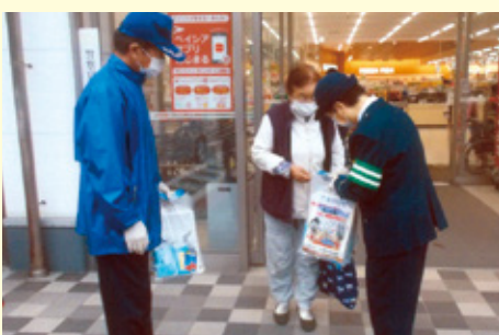
勝 浦 バイシアスーパーセンター勝浦店での交通安全キャンペーン