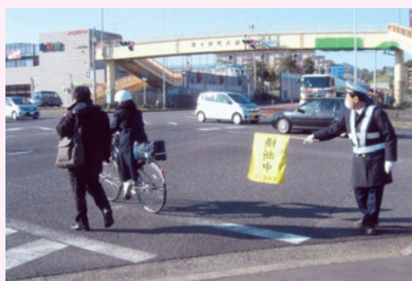
佐倉 主要交差点での保護・誘導活動