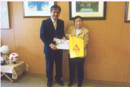
茂原 新入学児童用交通安全ランドセルカバー贈呈式