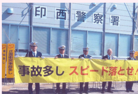
印西 横断幕・反射立て看板の作成