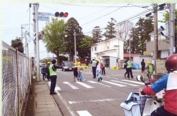
千葉南交通安全協会

交通安全協会では、関係機関と連携し、県内の各地において通学路での保護・誘導活動等を実施するほか、学校等において交通安全教室を開催するなど、交通事故の抑止に努めています。 『子供は動く赤信号』です。ドライバーの皆さんも子供を見かけたら「飛び出し事故」を予測して速度を落としましょう。 交通法規を守り安全に努めましょう。