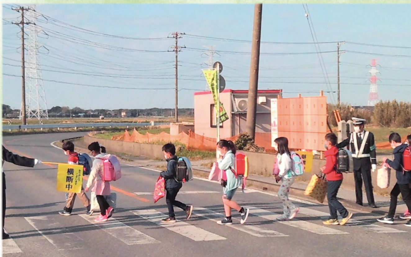
富津交通安全協会