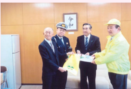
いすみ 新入学児童用交通安全ランドセルカバー贈呈式