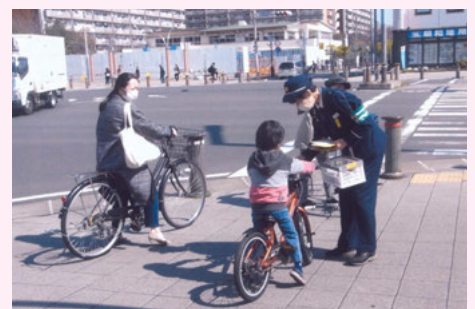
浦安 入船中央交差点での自転車交通安全キャンペーン