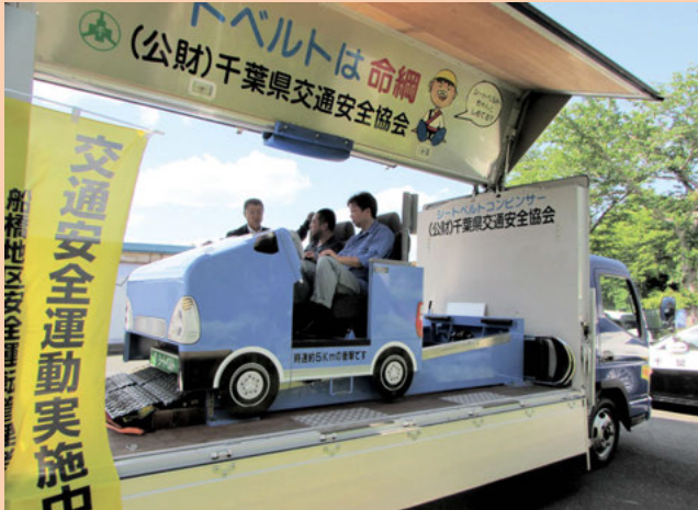
シートベルト着用効果体験