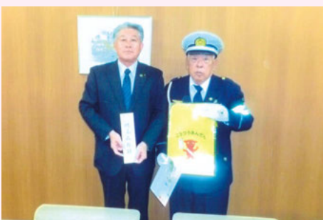
木更津 新入学児童用交通安全ランドセルカバー贈呈式