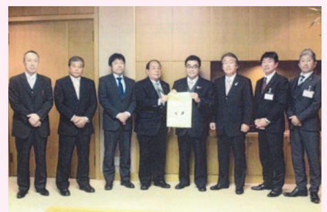
野田 新入学児童用交通安全ランドセルカバー贈呈式