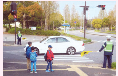
千葉南 児童登校時の街頭指導活動