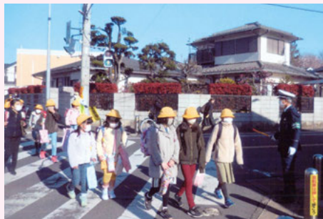
流山 児童登校時の街頭指導活動