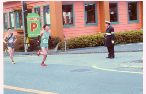
船橋 マラソン大会での歩行者の保護誘導活動