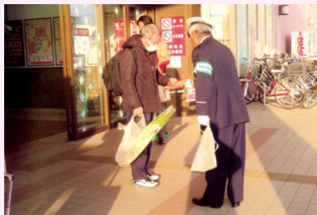
四街道 イトーヨーカドー四街道店入口での交通安全キャンペーン