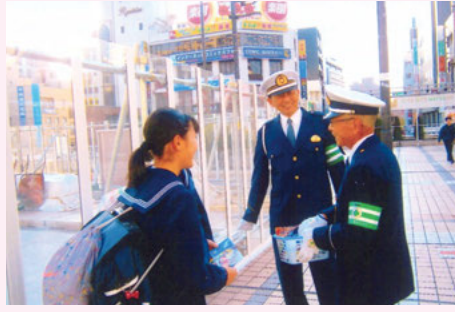
松戸 松戸駅での交通安全キャンペーン