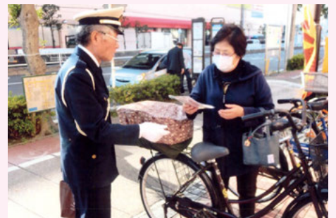
行徳 イオン南行徳店前での自転車安全利用キャンペーン