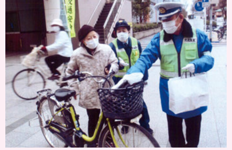
千葉南 イオンゆみーる広場での自転車安全利用キャンペーン