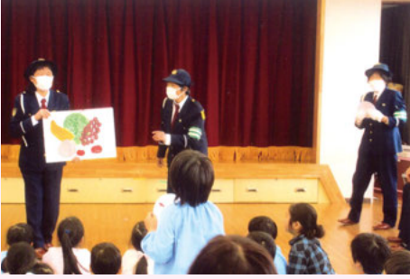
一宮 いちのみや保育所での交通安全教室