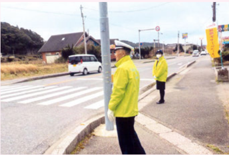
いすみ いすみ警察署入口交差点での街頭指導活動