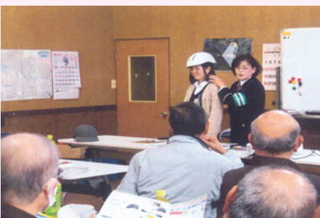
君津 空師青年館におけるヘルメット着用指導活動