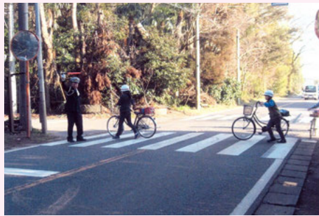
佐倉 二州小学校沖分校での自転車通学児童への交通安全指導