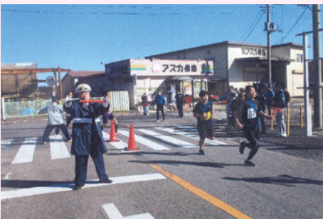
大多喜 マラソン大会での歩行者の保護誘導活動