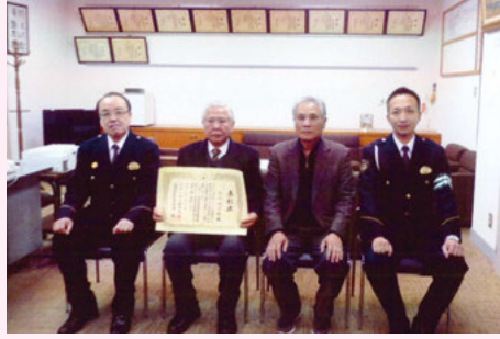
流山 警察署での緑十字表彰授与式