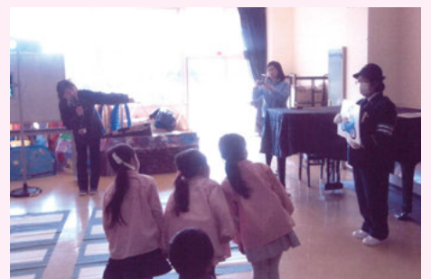
浦安 入船南認定こども園での交通安全教室