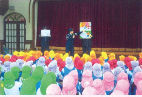
茂原 アップル幼稚園での交通安全教室