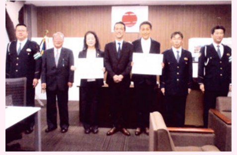
千葉中央 警察署での緑十字表彰授与式