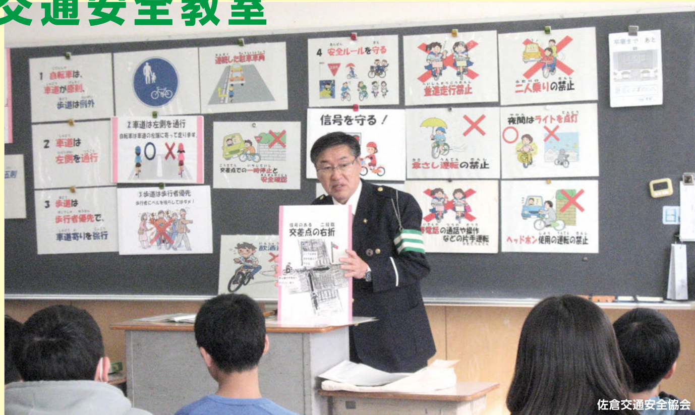
佐倉交通安全協会