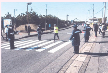
旭 マラソン大会での歩行者の保護誘導活動