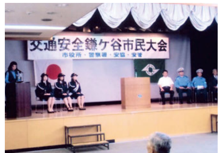
鎌ヶ谷 鎌ヶ谷市総合福祉保健センターでの交通安全鎌ヶ谷市民大会