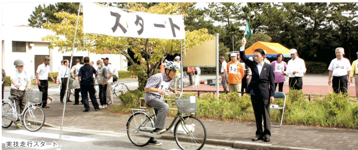
実技走行スタート