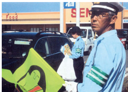
一宮 宮原交差点での交通安全キャンペーン