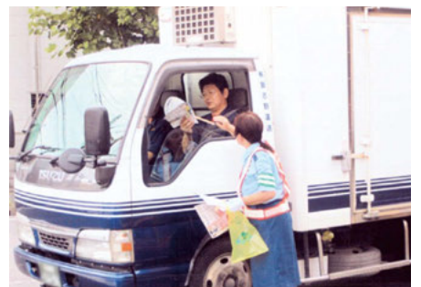
市川 大洲防災公園前でのシートベルト着用キャンペーン