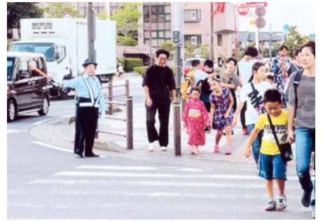
四街道 ふるさとまつり会場周辺での交通誘導活動