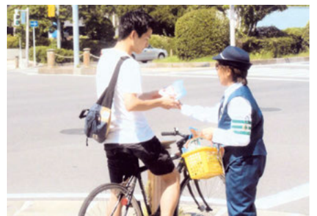
浦安 入船中央交差点での交通安全キャンペーン