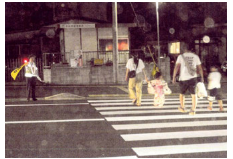
千葉南 誉田2丁目盆踊り会場での交通誘導活動