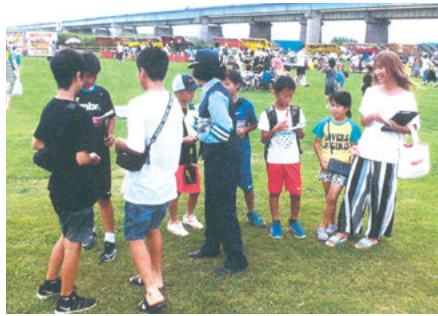
野田 江戸川宝珠花橋前での関宿祭りふれあいキャンペーン