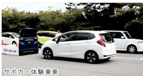
サポカー体験乗車