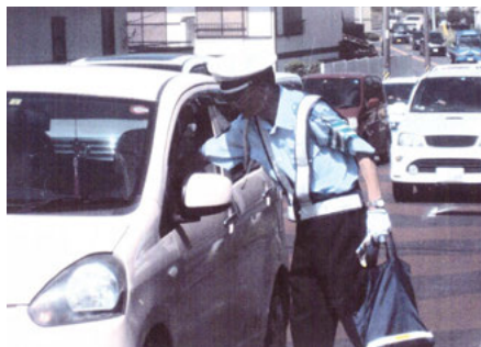
佐倉 佐倉市海隣寺町での交通安全キャンペーン