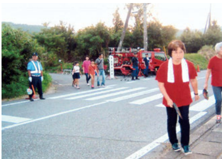
南総 加茂地区盆踊り大会での交通誘導活動