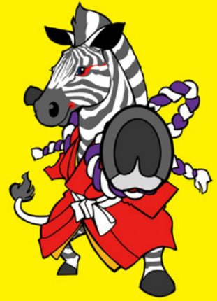
「ゼブラストップ活動 イメージキャラクター」