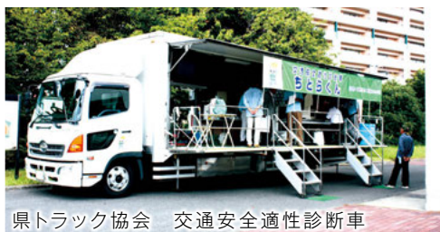
県トラック協会 交通安全適性診断車