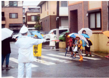
流山 鰯ヶ崎小学校付近での登校児童の交通誘導活動