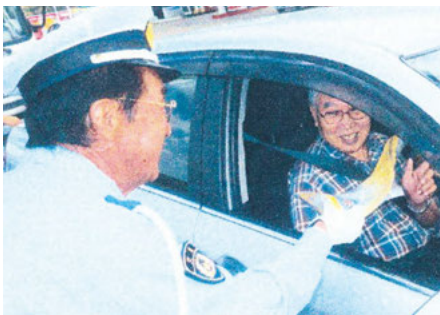
君津 味楽囲おびつ店前でのシートベルト着用キャンペーン