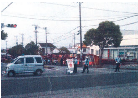
富津 富津ふるさとまつり会場での交通誘導活動