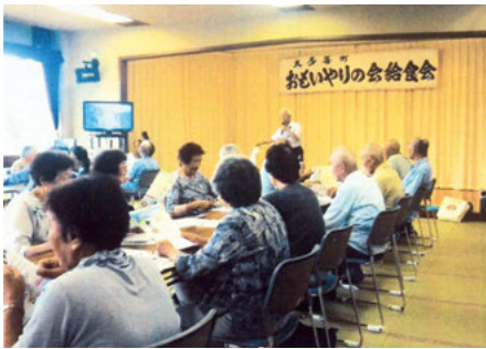
大多喜 大多喜老人福祉センターでの自転車用ヘルメットの着用広報