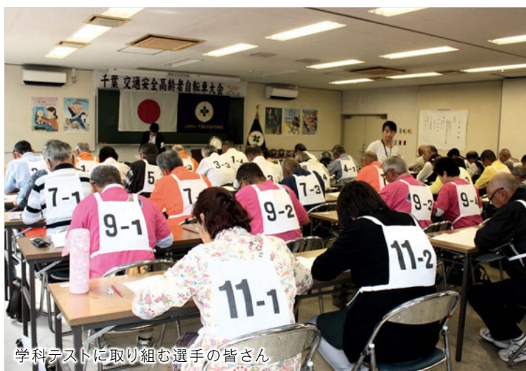
学科テストに取り組む選手の皆さん

10月10日(木)、県交通安全協会は、千葉市美浜区の花見川緑地交通公園で、「第10回千葉県交通安全高齢者自転車大会」を開催しました。 大会には、千葉中央、千葉西、千葉南、千葉北、船橋、松戸、松戸東、野田、柏、四街道、市原、木更津の12協会12チームが参加し、午前中は交通規則や標識に関する学科テスト、午後からは園内のコースを走行する実技テストが行われ、選手は安全走行や技能走行に懸命に取り組みました。