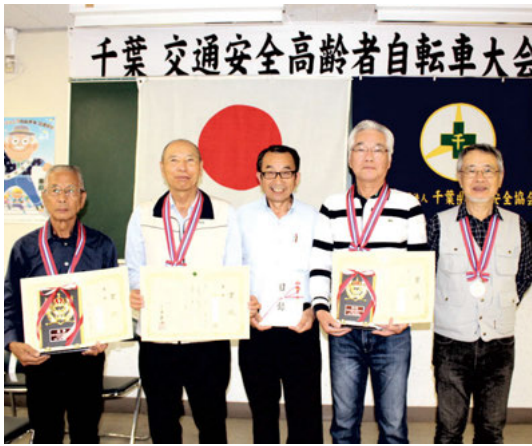
優勝したダックス松戸チームの皆さん