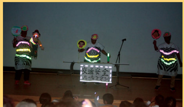
ピカッとちばコレクション