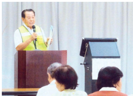
銚子 芦崎高齢者いこいセンターでの自転車用ヘルメットの着用広報