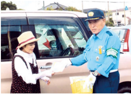
いすみ ふれあいショップ源氏周辺での交通安全キャンペーン