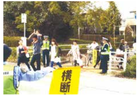
千葉南 昭和の森公園でふるさとまつりの交通整理及び誘導等を行った。