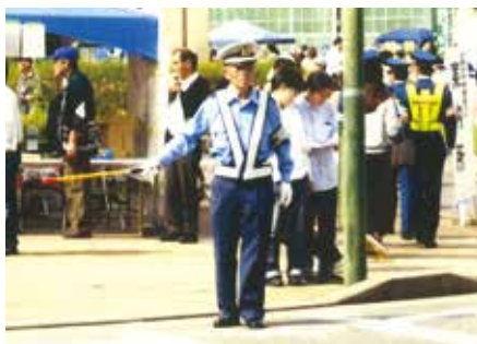
鎌ヶ谷 鎌ヶ谷市民まつりで交通整理及び誘導を行った。