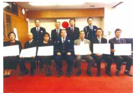
千葉東 警察署で交通栄誉章緑十字銅章の伝達式を行った。