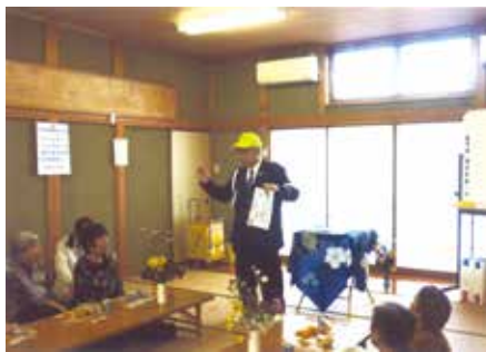
船橋東 古和釜自治会館で交通事故防止啓発活動を行った。