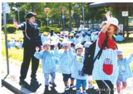
行徳 南沖交通公園で交通安全教室を行った。