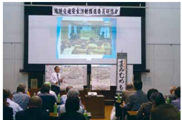
高山市原会長による事例発表 (10月7日・茂原会場)