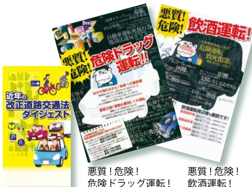
近年の改正道路 交通法ダイジェスト