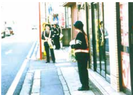
市川 国道14号市川市役所前でシートベルト着用広報啓発活動を行った。