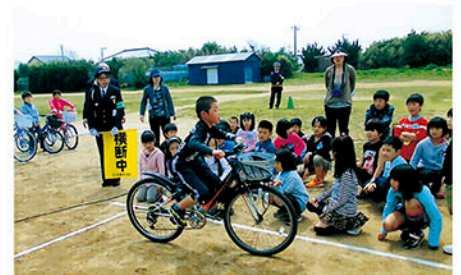
旭 三川小学校で自転車安全教室を開き啓発する。