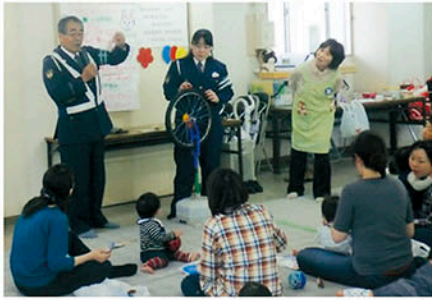
松戸東 子育て中の母親に対する交通安全教室を開き啓発する。