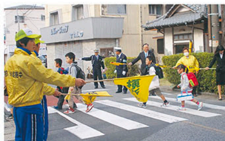
勝浦 運動に合わせ新入学児童の保護誘導活動を行う。