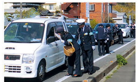
山武 警察署前交差点で特産の苺を配り無事故を訴える。