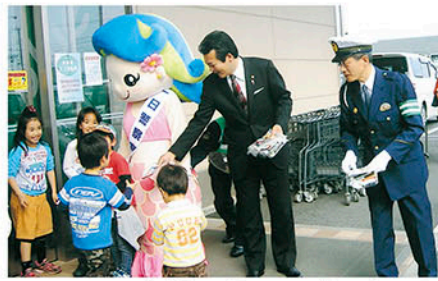
東金 大網ベイシアで市のキャラクターと広報活動を行う。