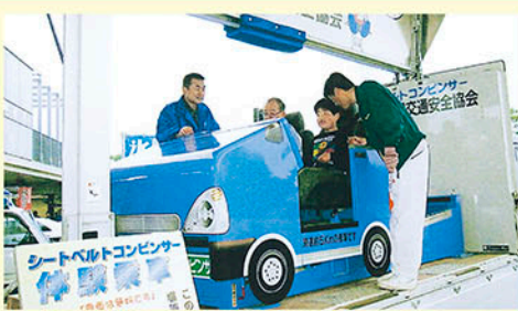
印西交通安全協会 シートベルトコンビンサー（衝突衝撃体験車）体験で着用の大切さを知る。