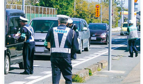
銚子 国道126号春日交差点でシートベルト着用を訴える。