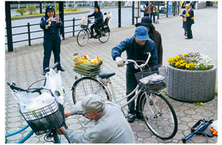
千葉東 ラ・パーク前で自転車点検し安全利用を訴える。