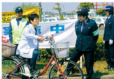
行徳 市川中央自動車教習所で体験型交通安全講習会を開く。