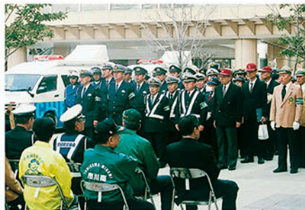
市川 J R 市川駅で運動に伴う出動式を実施し啓発する。