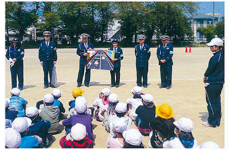
千葉中央 松ヶ丘小学校で交通安全教室を開き啓発する。