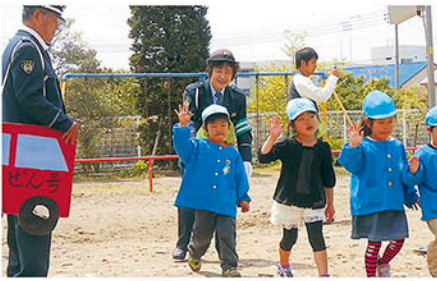
大多喜 町立みつば保育園で交通安全教室を開いて啓発する。