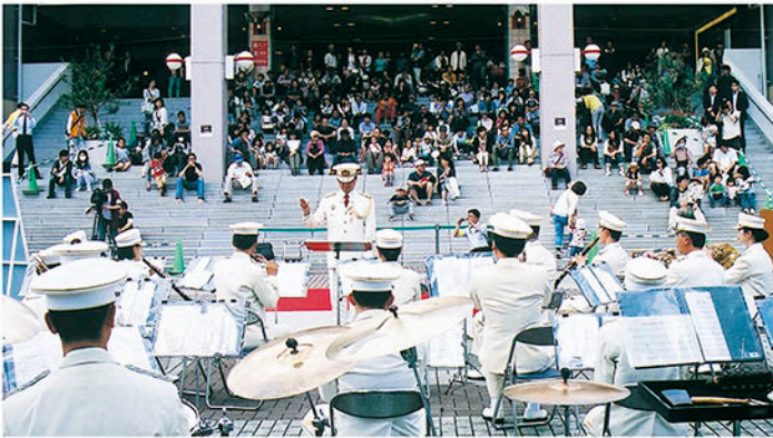
たくさんの人が県警音楽隊の演奏に耳を傾ける

サを差さない！」「大声で音楽を聞かない！」を一枚ずつ読み上げ、気軽に乗れる自転車だからこそいっそう慎重に走り、自転車の交通事故をなくそう、とコメントをはさみながら訴えました。県警音楽隊が軽快な音楽を演奏する中、「自転車も、のれば車のなかまより」のスローガンが入ったチラシや反射材などを配り、自転車の交通事故防止を呼びかけました。