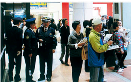
富津 ジャスコ富津店で啓発物を配り事故防止を訴える。