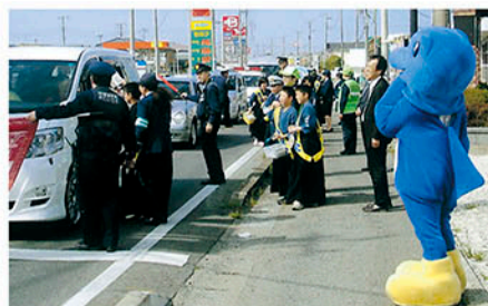
いすみ 国道128号で少年剣士などが街頭啓発活動を行う。