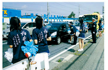
千葉北 国道16号で柏井高校チアダンス部員と啓発物を配る。