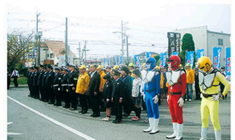
匝瑳 市役所前で出動式を行った後国道126号で啓発する。