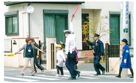
多古町 第一小学校近くの交差点で横断歩道の渡り方を教える。