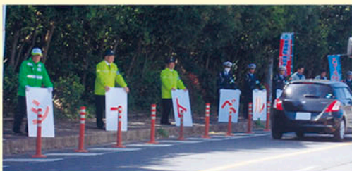
佐倉交通安全協会 文字ボードで運転者に呼びかける。