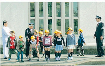
君津 外箕輪小学校で道路を活用しての安全教室を開催する。