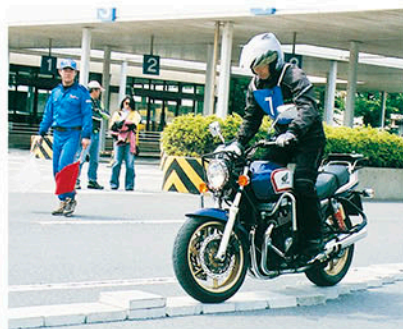
ブロックスネーク

腕に覚えがあるライダー達が薫風の中を駆け抜けました。5月25日、二輪車の交通事故防止とマナーの向上を目指す「2013二輪車安全運転千葉県大会(第43回ベストライダーコンテスト)」(主催「公財」千葉県交通安全協会・二輪車安全運転推進委員会、後援「県・県警・県教育委員会など」が、千葉市浜田の運転免許センターで行われました。昭和46年の第一回から回を重ね、二輪愛好者