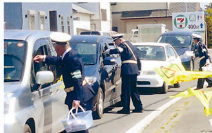
一宮 宮原交差点で啓発物を配り安全運転を呼びかける。