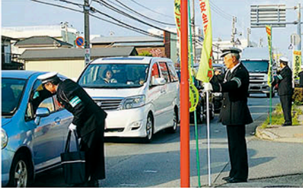
市原 幹線道路でのぼり旗を掲出し安全運転を呼びかける。