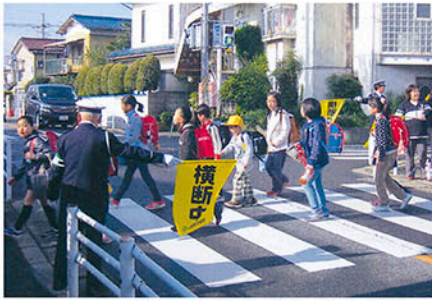
松戸 柿ノ木台小学校前交差点で登校時の保護・誘導を行う。

交通安全協会の活動にご協力いただきありがとうございます。会員の皆様の会費は、地元の交通安全協会ボランティア活動に活用されています。