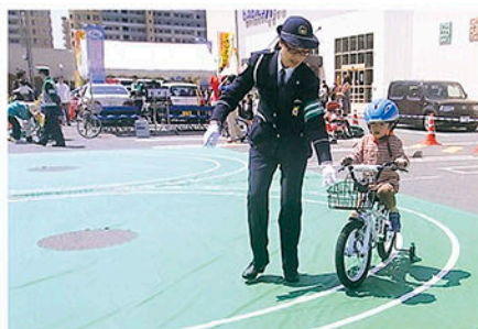
浦安 トイザラス店駐車場で自転車の安全な乗り方を教える。