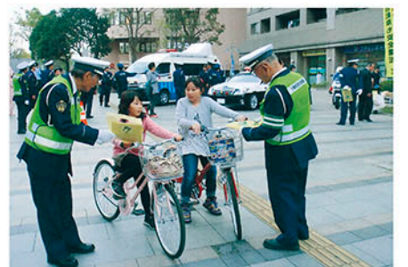
千葉南 おゆみ野イオン脇広場で自転車利用者に啓発物を配る。