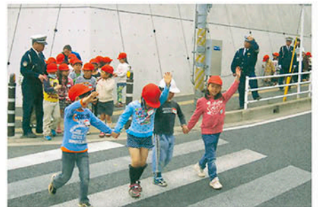
千葉西 花園小学校の通学路を歩き正しい横断等を指導する。