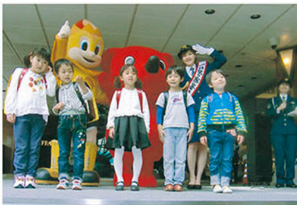
柏 J R 柏駅での出動式で新一年生が交通安全宣言をする。