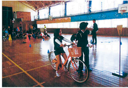
鎌ヶ谷 中部小学校で自転車安全教室を開き啓発する。