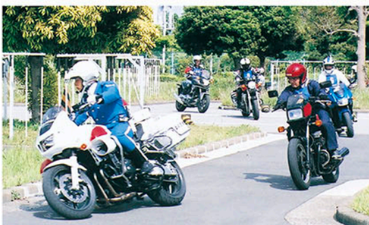
白バイ隊員を先頭に四輪コースを走る

腕に覚えがあるライダー達が薫風の中を駆け抜けました。5月25日、二輪車の交通事故防止とマナーの向上を目指す「2013二輪車安全運転千葉県大会(第43回ベストライダーコンテスト)」(主催「公財」千葉県交通安全協会・二輪車安全運転推進委員会、後援「県・県警・県教育委員会など」が、千葉市浜田の運転免許センターで行われました。昭和46年の第一回から回を重ね、二輪愛好者