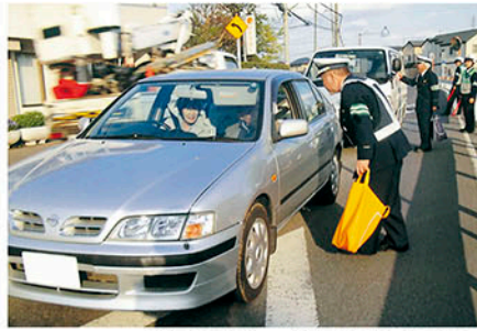
習志野 警察署前で飲酒運転撲滅キャンペーンを行う。