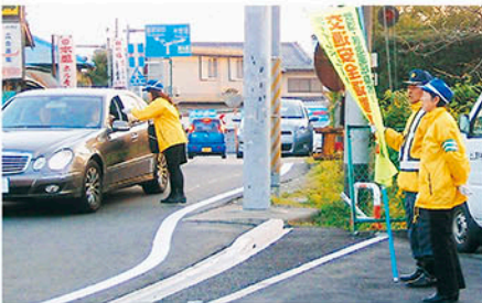
南総 米沢交差点で啓発物を配りながら事故防止を訴える。