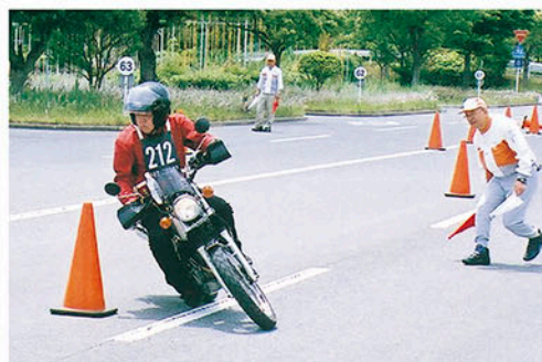
コンビネーションスラローム

に「ベストコン」という愛称で親しまれてきた本大会に今年は53名が参加し熱戦を展開しました。上位入賞者の中から選ばれた4人が8月に三重県鈴鹿サーキットで行われる全国大会に出場します。