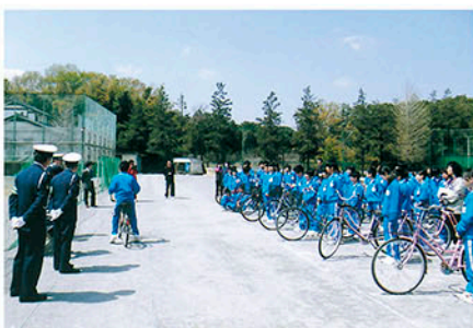
流山 八木中学校で自転車利用生徒に安全な乗り方を教える。