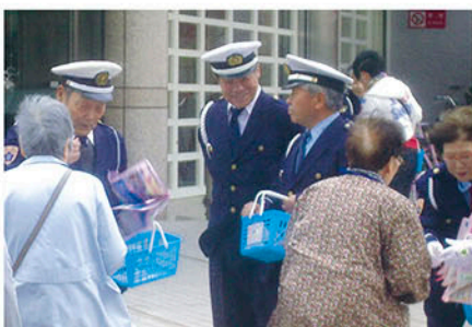
我孫子 けやきプラザ前で出動式後啓発物を配る。