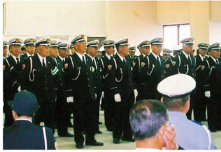
野田 市役所大会議室で関係機関団体と出動式を行う。