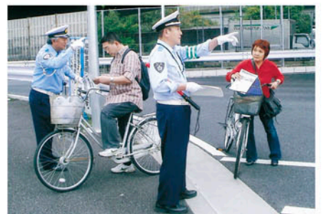
船橋 若松交差点で自転車の安全利用を呼びかける。