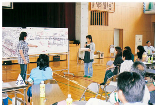
班ごとに危険箇所マップを作成して発表

要所をチェックしながら歩く一行に「今日は何?」と尋ねる町の人。「子ども達の通学路の安全点検です」と答える参加者達。「ご苦労様です」と、交通安全を願う町の人々に温かく受け入れられていたことを実感しつつ歩くこと約2時間。午後は各班で危険箇所マップを作成し、改善策等の発表を行いました。