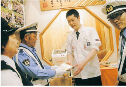
東金 酒類提供店でハンドルキーパー運動参加を呼びかける。