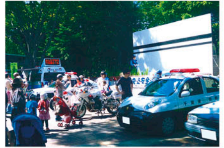
千葉東 千葉市動物公園で交通安全フェアを開催し啓発する。