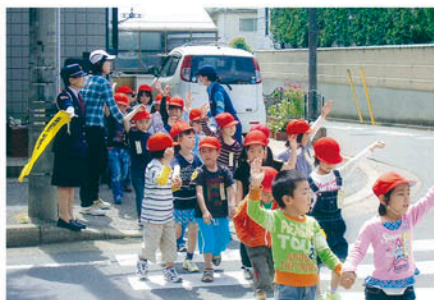
我孫子 市立我孫子第三小学校で体験型交通安全教室を開く。