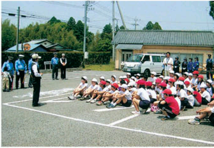
多古町 町立久賀小学校でコミュニティ事業の安全教室を開く。

交通安全協会の活動にご協力いただきありがとうございます。会員の皆様の会費は、地元の交通安全協会の交通安全ボランティア活動に活用されています。