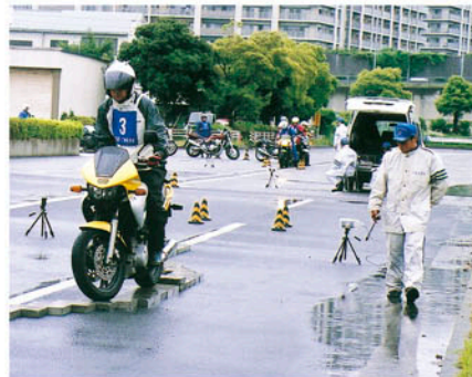
ブロックスネーク