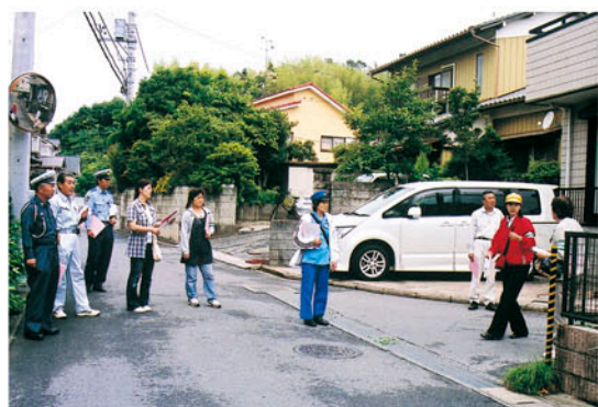
見通しの悪い交差点を点検

県交通安全協会連合会が県から委託を受けて行っている交通安全コミュニケーション事業の「地域ぐるみ総点検」が6月14日、栄町の安食小学校の学区で行われました。通学路の安全をあらゆる立場から見直そうと、この日参加したのはPTA、町役場、警察署、自治会役員、交通指導員など54人。体育館で主催者挨拶の後、点検要領の説明を行い、5班に分かれて点検に出ました。