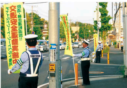
市原 若宮地区で交通事故死ゼロの日キャンペーンを行う。