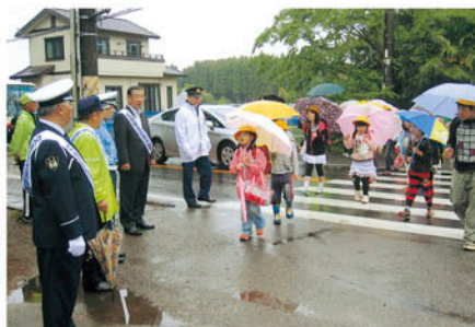
佐倉 八街市立川上小学校で登校児童の安全を見守る。