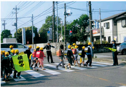
茂原 大芝交差点で中の島小学校児童の保護活動を行う。