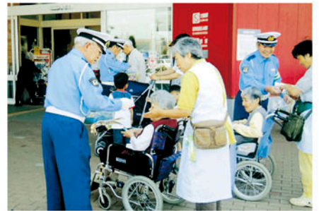
千葉北 ワンズモールで啓発物を配り交通安全を訴える。