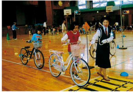
鎌ヶ谷 市立鎌ヶ谷小学校で自転車安全教室を開き啓発する。