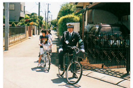
船橋東 通学路を使い自転車の安全な乗り方を実技指導する。