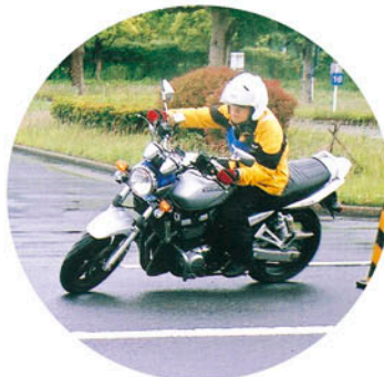
コンビネーションスラローム