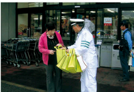
館山 鋸南町の店舗前で啓発物を配り無事故を呼びかける。