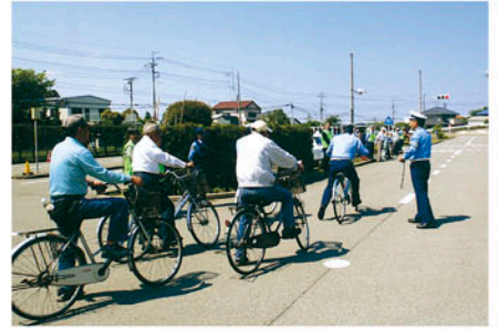
千葉南 自動車教習所でシニア自転車教室を開催する。