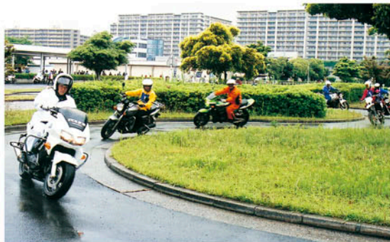
競技終了後白バイを先頭に四輪コースを走る

二輪車の安全運転とマナーの向上を目指す「2011二輪車安全運転千葉県大会(第41回ベストライダーコンテスト)」(主催〓県交通安全協会連合会・後援〓県、県警察、県教育委員会など)が5月28日、千葉市美浜区の運転免許センターで行われました。雨天の中、40人が参加し一本橋走行やコンビネーションシラロームに熱心に取り組みました。 大会の上位入賞者の中から選ばれた4人が8月6日、7日に三重県鈴鹿サーキットで行われる全国大会に千葉県代表として出場します。