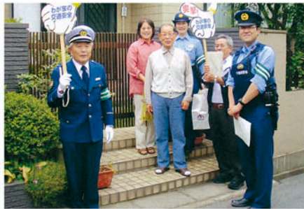
流山 高齢者宅を訪問し交通安全を呼びかける。