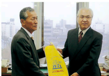
木更津 木更津市教育委員会で新入学児童に安全用品を贈る。