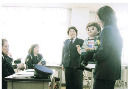
東金 大網白里町中央公民館で女性交通指導員が研修を行う。