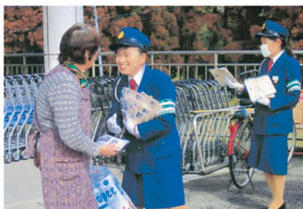
君津 君津市のスーパー前で啓発物を配り交通安全を訴える。