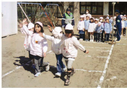
一宮 一宮保育所で模擬道路をしい道路横断の指導をする。

交通安全協会の活動にご協力いただきありがとうございます。会員の皆様の会費は、地元の交通安全協会の交通安全ボランティア活動に活用されています。