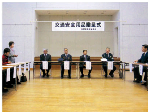
茂原交通安全協会 茂原市役所で「交通安全用品贈呈式」 を行う。