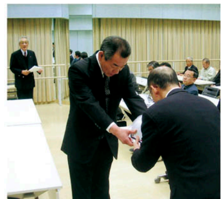
館山交通安全協会 管内8中学校の新入生に自転車 用ヘルメットと夜光腕章を贈る。

◎ 県交通安全協会連合会では、今年も「交通安全下敷き」5万9千枚と横断旗を作成し、各地の交通安全協会を通じて新入学児童にプレゼントしました。