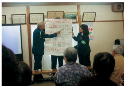
松戸東 八ヶ崎新町の高齢者を対象に交通安全教室を開催する。