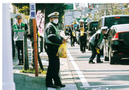
市川 警察署前の県道でシートベルトの着用を呼びかける。