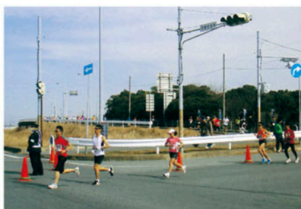
富津 県民マラソン大会で交通整理と誘導に従事する。