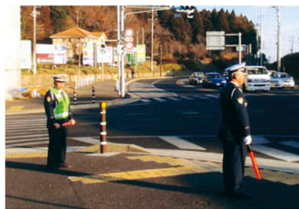
千葉南 ホイッスル作戦に伴う街頭啓発活動を行う。