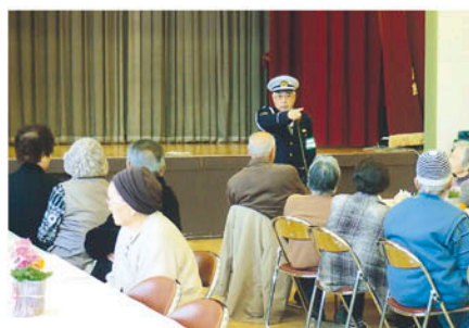
船橋東 北部公民館でマジックを使った高齢者講習会を開く。