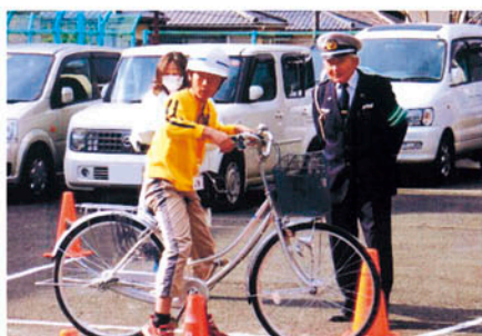
佐倉 八街北小学校で自転車安全教室を開いて指導する。