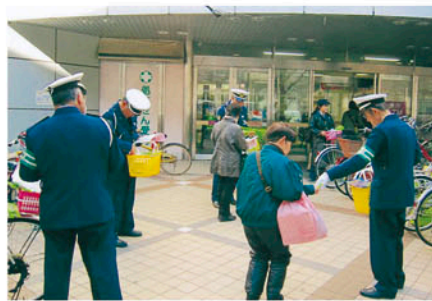
千葉西 イオン稲毛店で啓発物を配り無事故を呼びかける。