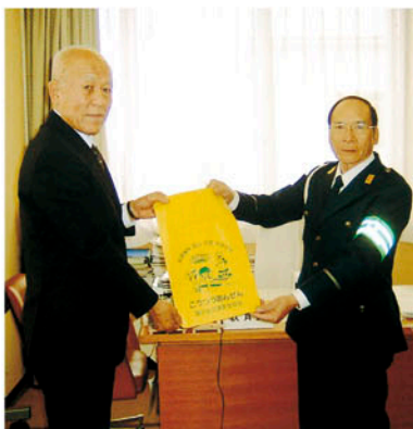
鎌ヶ谷交通安全協会 管内9小学校の新入学児童に ランドセルカバー等を贈る。