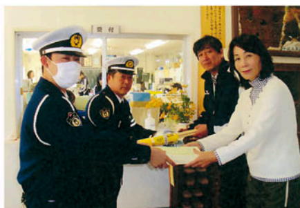
流山 管内15小学校の新入学児童に交通安全下敷き等を贈る。