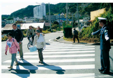
鴨川 鴨川ウォークラリー大会で交通整理と保護誘導を行う。