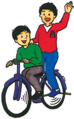
二人乗りは禁止です。 ルールを守りましょう。