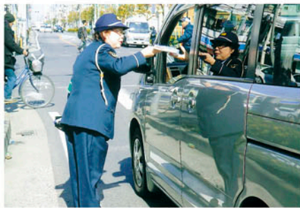
行徳 新浜交差点で全席シートベルト着用の啓発活動を行う。