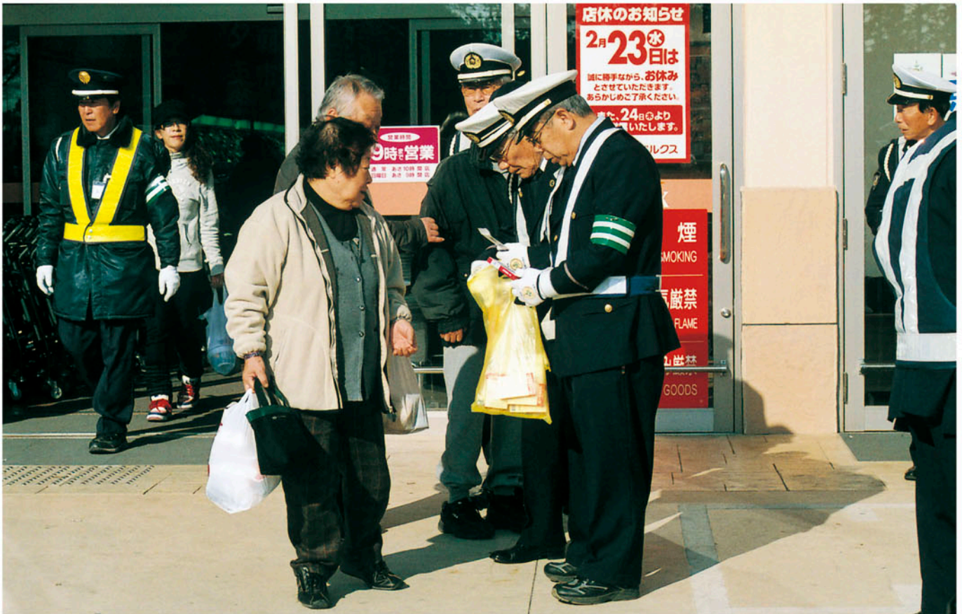
市川交通安全協会 大型スーパーの前で高齢者に交通事故防止を呼びかける。