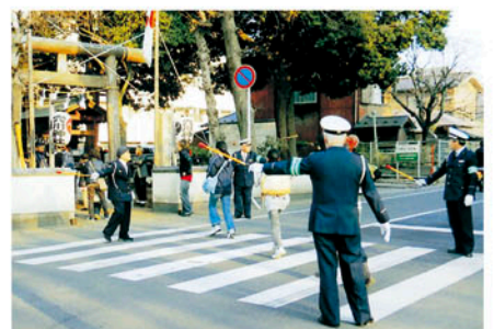
千葉北 穴川神社の節分祭りに伴う交通整理に従事する。