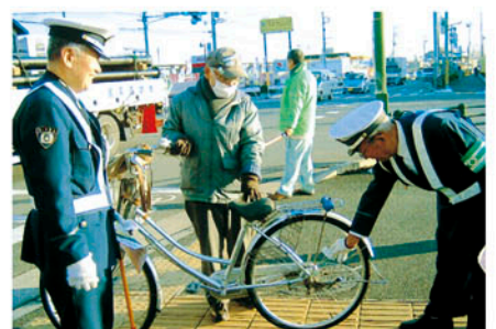
鎌ヶ谷 主要交差点で自転車利用の高齢者に安全利用を訴える。