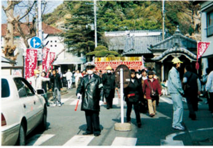
勝浦 ビッグひな祭り会場では歩行者の安全確保を図る。