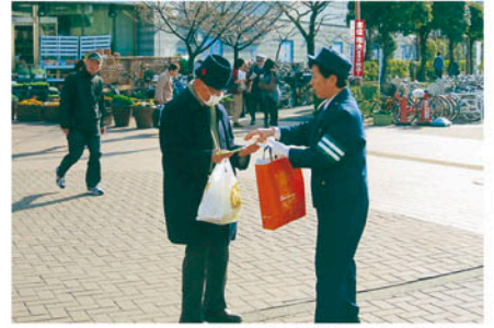
千葉西 JR稲毛海岸駅で高齢者の交通事故防止を訴える。