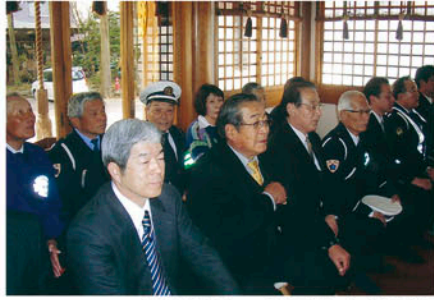
我孫子 柴崎神社で交通安全祈願祭を行い無事故を祈る。