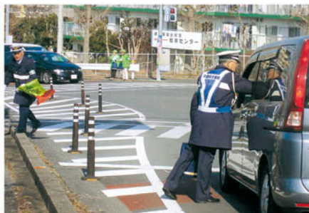
佐倉 市役所下交差点で街頭啓発活動を行う。