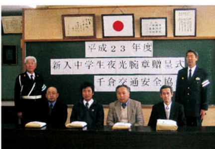
千倉 新中学1年生に夜光腕章等を贈り無事故を訴える。