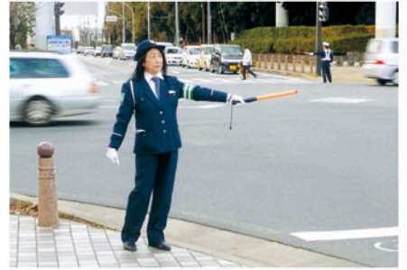
千葉中央 セーフティ40日作戦に伴い交差点で街頭指導を行う。