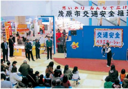
茂原 アスモで交通安全推進市民大会を開き啓発する。

交通安全協会の活動にご協力いただきありがとうございます。会員の皆様の会費は、地元の交通安全協会ボランティア活動に活用されています。