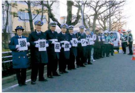
浦安 東野小学校前で全席シートベルト着用を呼びかける。