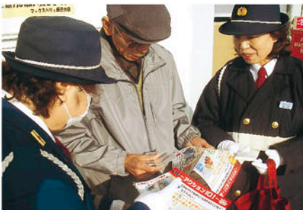
市原 セーフティ40日作戦の活動で啓発物を配る。