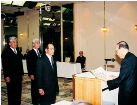
無事故・無違反運動で優秀な成績をあげた地区協会を表彰