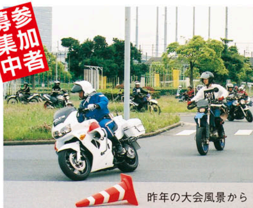
昨年の大会風景から