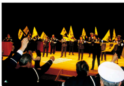
山武 のぎくプラザで新任交通指導員の研修会を行う。