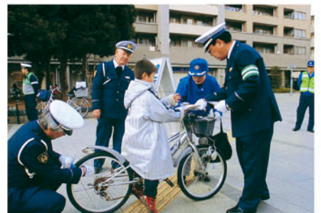
千葉南 おゆみ野ゆみーる広場で自転車安全利用を呼びかける。