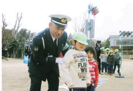
東金 正気幼稚園で正しい横断方法等を指導する。