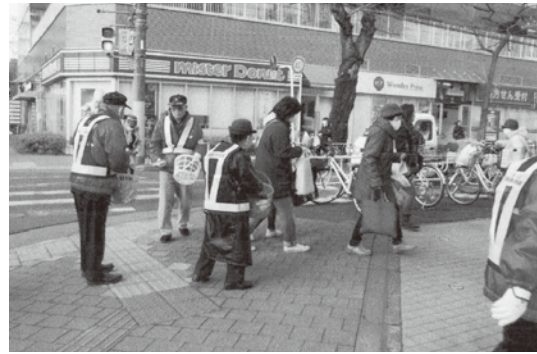
松 戸 東

1月29日、東野小学校前さくら通りにおいて、警察・関係団体と協力し、通行車両にチラシや啓発物資を配布して、シートベルト着用を呼び掛けた。