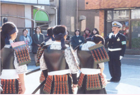
君 津 児童甲冑隊による交通安全キャンペーン