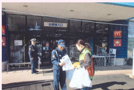
大 多 喜 おおたきショッピングプラザオリブでの交通安全キャンペーン