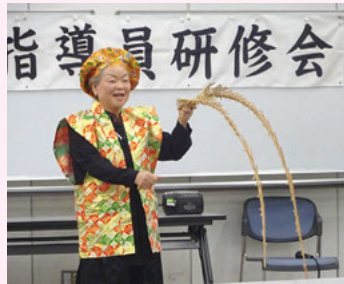
1月24日 市川(行徳)会場