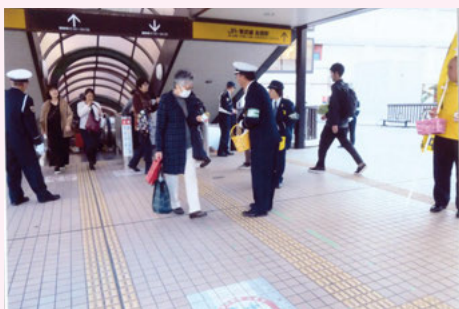
船橋 JR船橋駅北口お祭り広場での交通安全キャンペーン