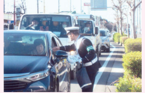
佐 倉 佐倉市王子台での啓発活動