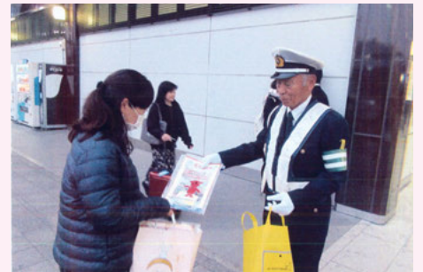
成 田 JR成田駅前での交通安全キャンペーン