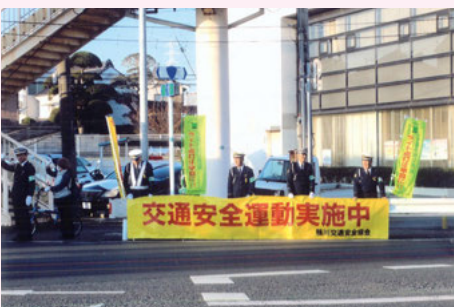
鴨 川 国道128号での交通安全キャンペーン