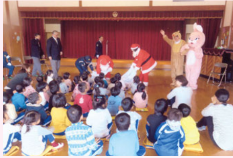
東 金 第3保育所での交通安全教室