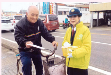
い す み 大原交差点での交通安全キャンペーン