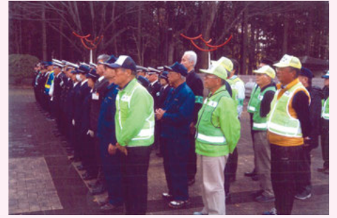
野 田 野田市役所での年末年始防犯・交通取締り出動式