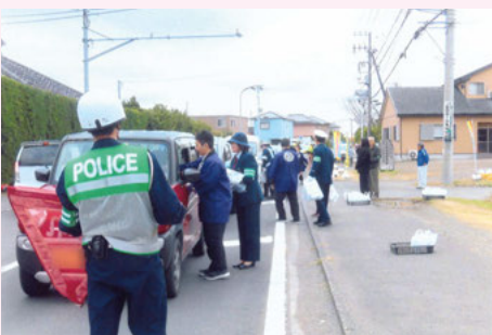
千 倉 国道128号での交通安全キャンペーン