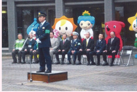
茂 原 市役所での年末年始特別警戒出動式