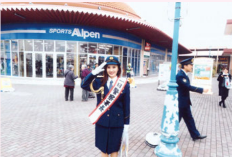
館 山 1日警察署長参加の交通安全キャンペーン