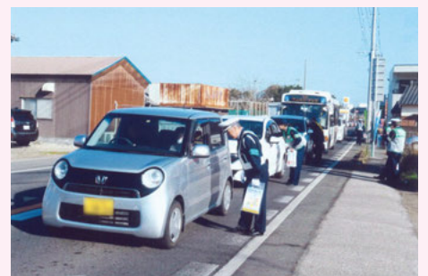
鈿 子 春日町での交通安全キャンペーン