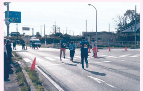
旭 旭市民駅伝大会での交通安全誘導活動