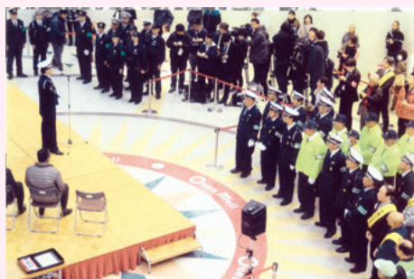
千葉北 ワンズモールでの歳末警戒取締り出動式