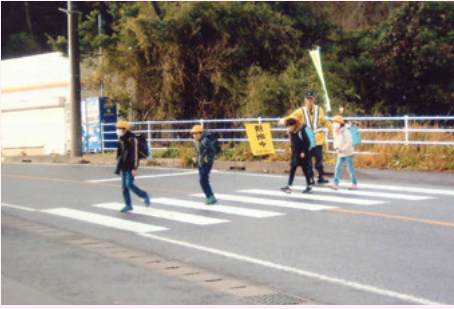
南 総 加茂学園付近での安全誘導活動