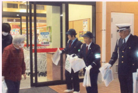
一 宮 スーパーせんだうでの交通安全キャンペーン