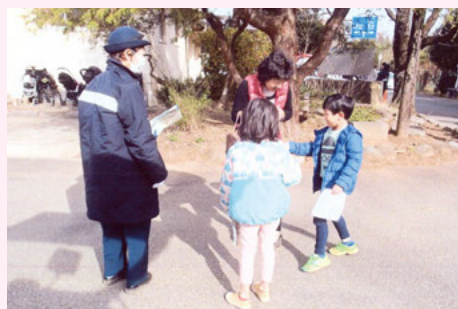
千葉東 「大相撲ふれあいイベントin白井」での啓発活動