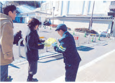
成田 成田山新勝寺駐車場において交通安全を呼び掛けた。

交通安全協会の活動にご協力いただきありがとうございます。会員の皆様の会費は、地元の交通安全協会の交通ボランティア活動に活用されています。