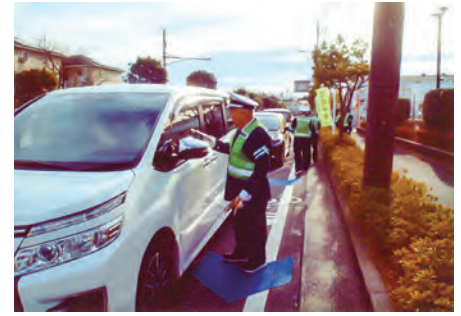
千葉南 おゆみ野中央8丁目交差点においてチラシ・啓蒙品を配布して飲酒運転追放を呼び掛けた。