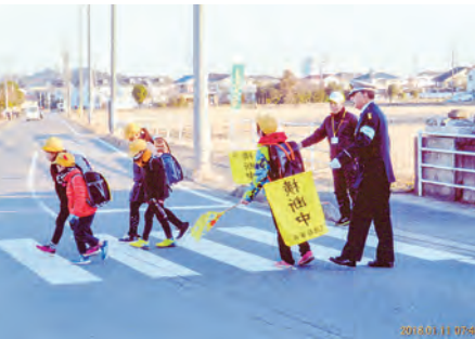
茂原 五郷小学校入口交差点において学期始め学童安全誘導を実施した。