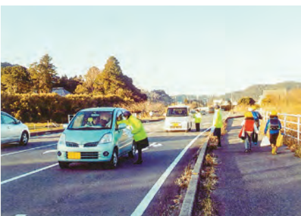
いすみ グリーンスパ前において運転者に安全運転を呼び掛けた。