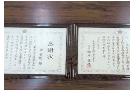
習志野 習志野警察署長感謝状が交通安全協会会長及び事務局長に授与された。