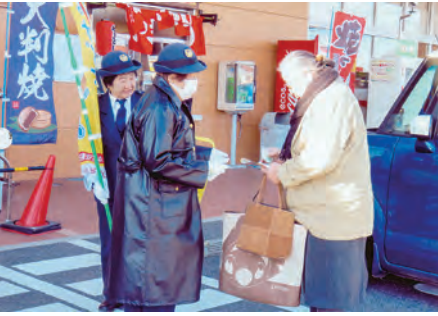
東金 スーパーせんだう入口において啓蒙品を配布してシートベルト着用を呼び掛けた。