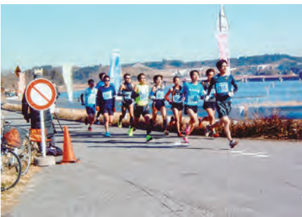
南総 高滝湖畔新春マラソンにおいて交通整理誘導を実施した。