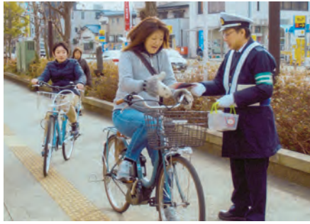
浦安 北栄ダイエー店前において、自転車のルールとマナーの遵守を呼びかけた。