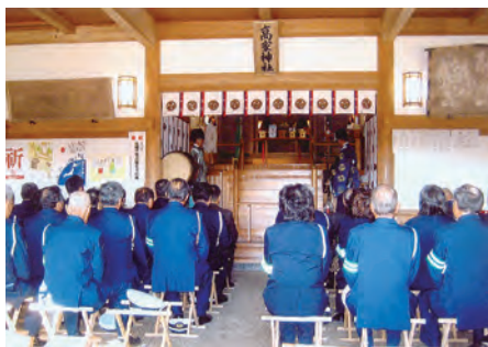
千倉 高家神社において交通安全祈願祭を行い交通安全を祈願した。