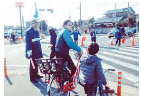
鎌ヶ谷 第43回鎌ヶ谷新春マラソン大会において交通誘導を実施した。