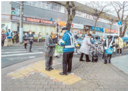
松戸東 常盤平西友前において自転車等マナーキャンペーンを実施した。