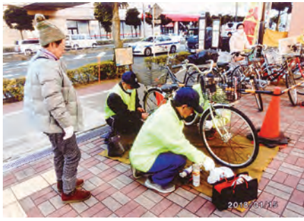
行徳 イオン南行徳店周辺において、自転車安全利用キャンペーンを実施した。