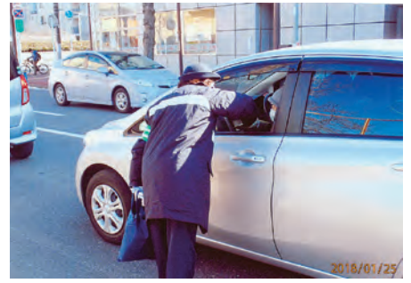
千葉東 千城台高校近くの交差点においてチラシ・啓蒙品を配布しシートベルト着用を呼び掛けた。