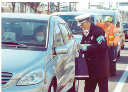
佐倉 王子台交差点においてチラシ・啓蒙品を配布してシートベルト着用を呼び掛けた。