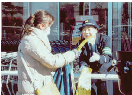
野田 イオンタウン七光台駐車場において反射材・チラシを配布して交通事故防止を呼び掛けた。