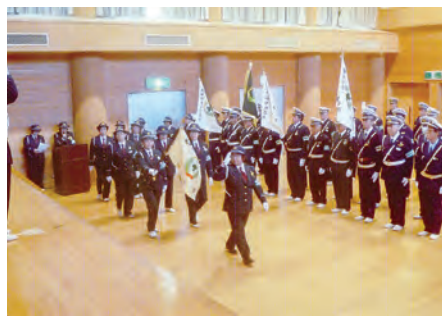
君津 清和公民館多目的のホールにおいて平成30年交通安全初出式を実施した。