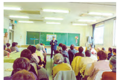
船橋東 高齢者の集いでヘルメット着用による交通事故防止を訴えた。