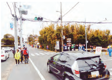
館山 セブンイレブン藤原店交差点において第38回若潮マラソン大会の交通誘導を実施した。