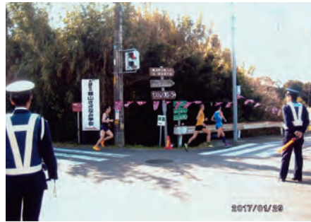
館山 第37回若潮マラソン大会において、交通誘導を行った。