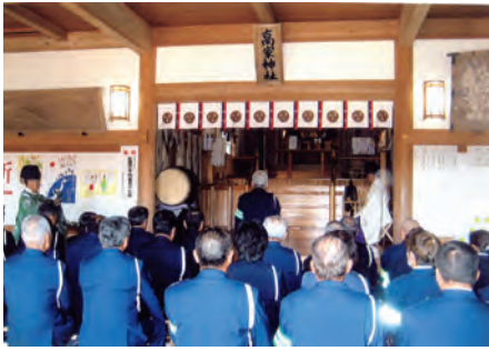
千倉 高家神社において、交通安全祈願祭を行った。