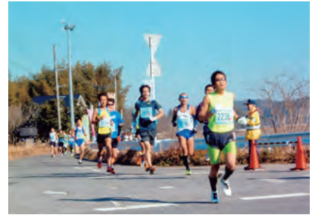
南総 市原高滝湖マラソンにおいて、参加選手の安全誘導を行った。