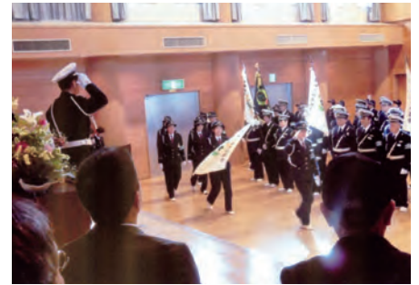
君津 清和公民館多目的ホールにおいて、交通安全初出式を行った。