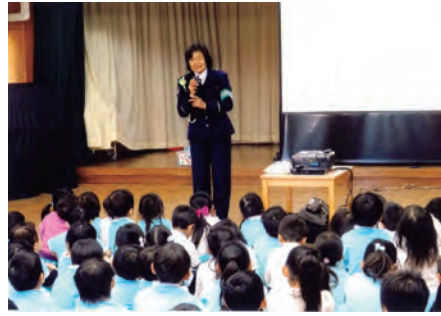
富津 青堀保育園において、幼児交通安全教室を行った。