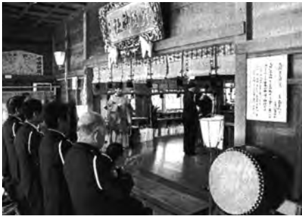
鴨川 天津神明宮において、交通安全祈願祭を行った。