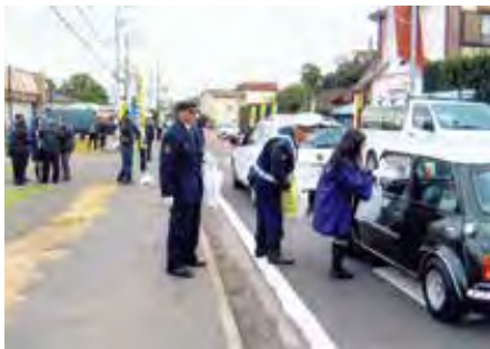
千倉 国道128号において啓発品を配布して交通事故防止を呼びかけた。