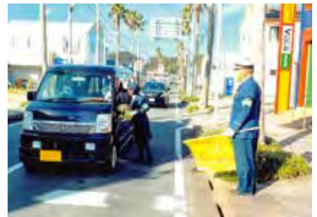
いすみ 御宿町千葉銀行前において交通安全キャンペーンを実施した。