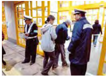
木更津 市内大型商業施設において啓発品を配布して交通安全を呼びかけた。