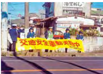
鴨川 横渚交差点において街頭監視を実施した。