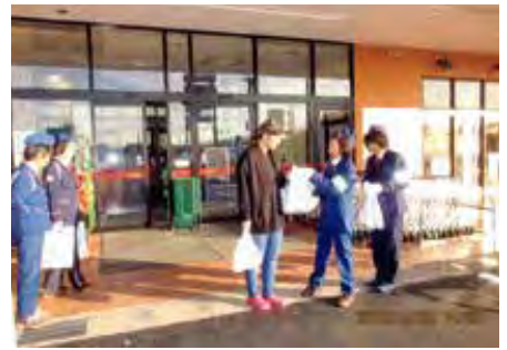
一宮 町内スーパー入口において交通安全啓発活動を実施した。