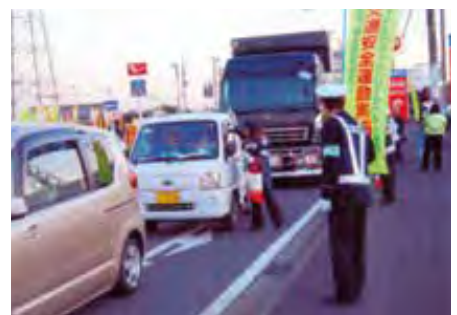
市原 主要交差点において、飲酒運転根絶と交通安全を呼びかけた。