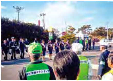
館山 年末年始特別警戒の出動式を行った。