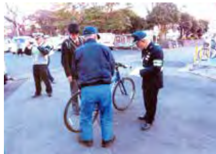
君津 君津駅南口駐輪場周辺において高校生に自転車の安全利用を呼びかけた。