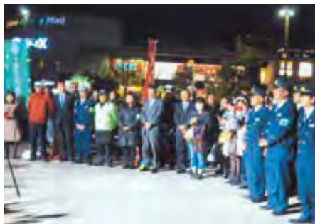
千葉西 JR海浜幕張駅において冬の交通安全運動キャンペーンを実施した。