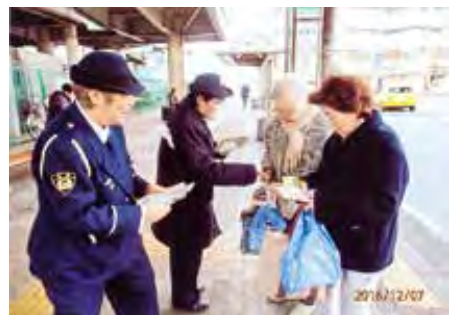
千葉東 JR都賀駅東口西口において啓発品を配布して交通安全を呼びかけた。