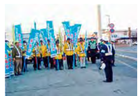
南総 市原市米沢交差点において啓発品を配布して交通安全を呼びかけた。

講習会参加者からは、「今回の研修を生かして、工夫しながら高齢者に対する交通安全指導に取り組んでいきたい」との声が寄せられました。