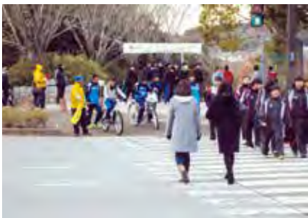
千葉南 創造の杜公園周辺において土気地区小中学生マラソン大会に伴う交通整理誘導を行った。