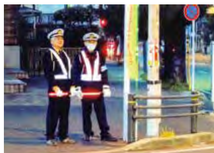
富津 市内主要交差点において冬の安全運動に伴う街頭監視を実施した。