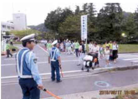
茂原 長南町花火大会会場入り口にて交通整理誘導を行った。