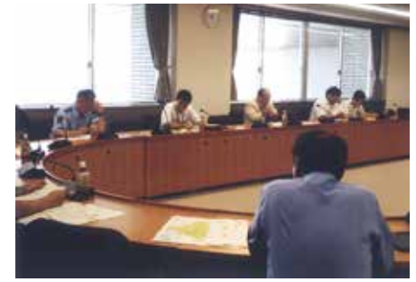
船橋 関係機関・団体合同で死亡事故多発緊急会議を開催した。