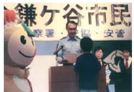
鎌ヶ谷 交通安全鎌ヶ谷市民大会で交通安全ポスター・標語コンクール入賞者の表彰を行った。