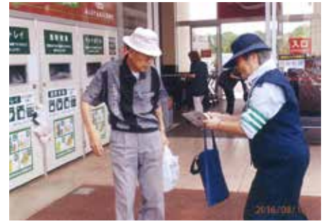
千葉東 スーパーカスミ千城台店にてチラシ・啓発品を配布し交通事故防止を呼び掛けた。