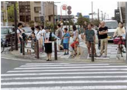
四街道 四街道ふるさとまつり会場周辺で交通整理誘導を行った。