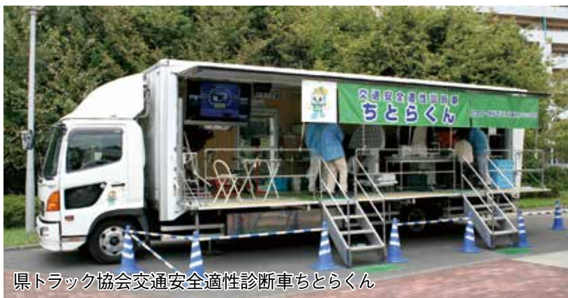
県トラック協会交通安全適性診断車ちとらくん

10月13日(木)、県交通安全協会は、県・県警・千葉市・県自転車軽自動車商協同組合・千葉市交通安全協会の後援と県自動車練習所・県トラック協会・キリンビバレッジバリューベンダー株式会社の協賛を得て、「第7回千葉県交通安全高齢者自転車大会」を千葉市美浜区の花見川緑地交通公園にて開催しました。 大会には千葉中央、千葉東、千葉西、千葉南、習志野、船橋、松戸、松戸東、野田、柏、四街道、東金、市原、木更津の14協会14チーム56人が参加し、午前中は交通規則や標識に関する学科テスト、午後は園内のコースを走行する実技テストに臨みました。選手は合図を正確に行い、安全に走りながら、ピンの間を走り抜けるジグザグ走行やS字走行に懸命に取り組みました。