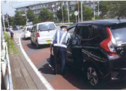
佐倉 佐倉市役所下交差点にてアクション10に伴う街頭啓発活動を行った。