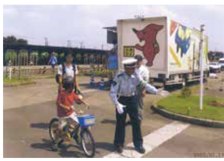
流山 子供自転車安全教室で交差点における横断方法の指導を行った。