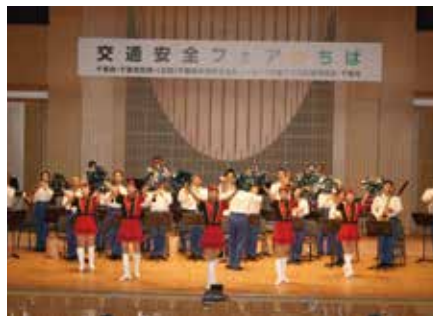
県警音楽隊の演奏会

9月27日、京葉銀行文化プラザの音楽ホールで、反射材を身につけて交通事故防止を呼び掛ける「交通安全フェア☆ちば」（主催＝県・県警・県交通安全協会・県安全運転管理協会 後援＝千葉市）が開かれました。ワンポイント交通安全教室・ピカッとニットちばコレクションや音楽会の二部構成で行われ、ファッションショーでは、反射する編み物を使用して衣装を製作した約80人が登場しました。