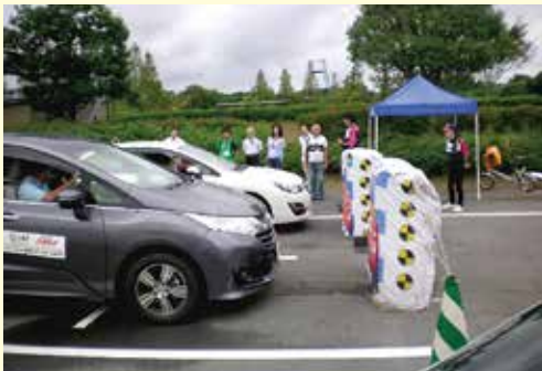
衝突軽減装置・自動ブレーキの体験

9月18日、セーフティレーニング（日本自動車連盟（JAF）など主催、県、県警、県交通安全協会など後援）が成田市にある日本自動車大学校構内で開催されました。これは、ドライバー参加体験型の交通安全教室といえるもので、正しいハンドル操作、急ブレーキ講習、ESC（横滑り防止装置）体験、エアバッグ展開実験、ASV（先進安全自動車）体験、危機回避などを学びました。