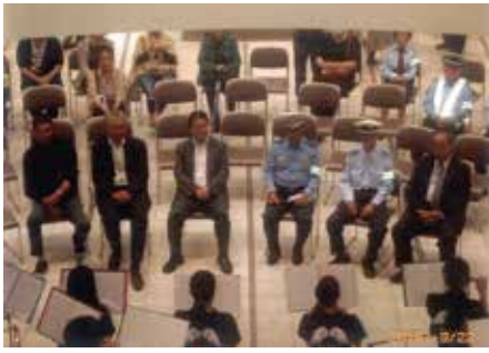
我孫子 中央学院大学吹奏楽部による交通安全演奏会を行った。

交通安全協会の活動にご協力いただきありがとうございます。会員の皆様の会費は、地元の交通安全協会の交通安全安全ボランティア活動に活用されています。