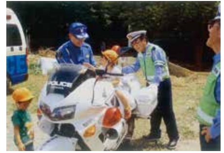
千葉南 リルガーデン保育園において交通安全教室と白バイのふれあい体験を行った。