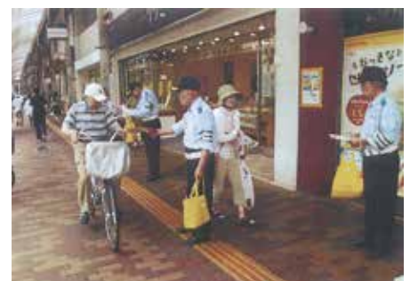
船橋東 習志野のJUJU広場にて主に高齢者を対象に啓発品を配り交通事故防止を呼び掛けた。