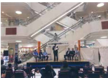
成田 ユアエルム内にて秋の全国交通安全運動キャンペーンを実施した。