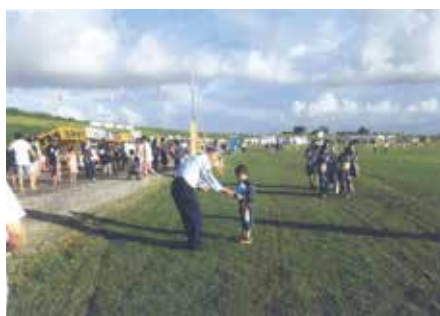
野田 関宿まつりの会場で啓発品を配りながら交通事故防止を呼び掛けた。