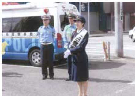
君津 アビタ君津店周辺道路で1日警察署長の啓発活動及び君津市交通安全ふれあいコンサートを実施した。