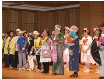
反射糸を用いた手作り作品のファッションショー