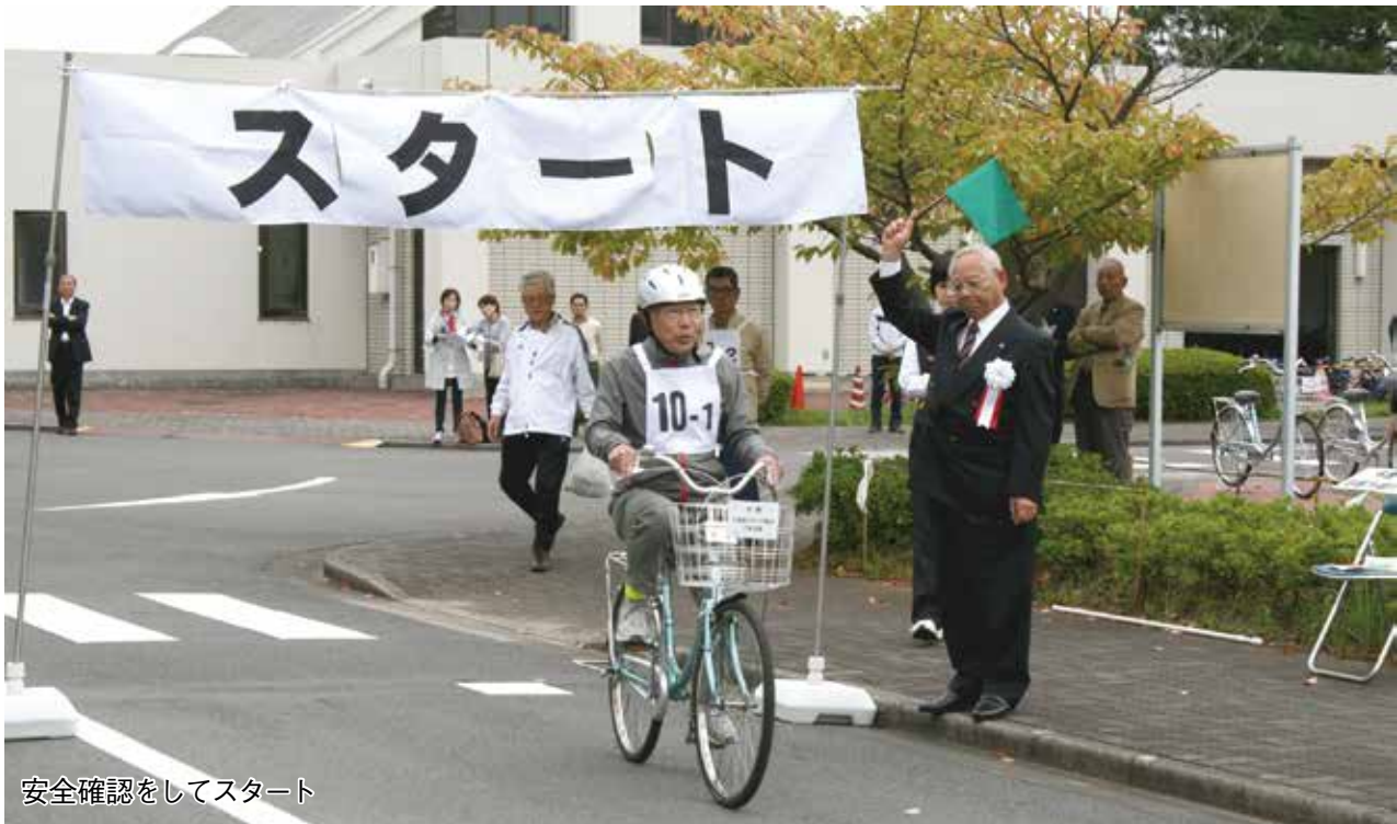
安全確認をしてスタート