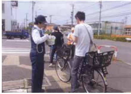
浦安 富士見交番前交差点において自転車利用者に交通安全を呼び掛けた。