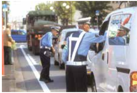
市川 大洲防災公園前で啓発品を配布して交通安全を呼び掛けた。