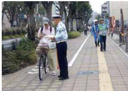
松戸 ダイエー新松戸店前で自転車利用者に交通安全を呼び掛けた。