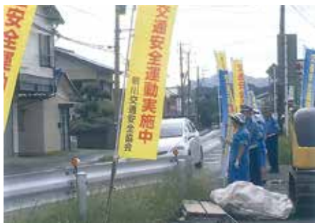
鴨川 鴨川市内の交差点でのぼり旗・横断幕を掲出して交通安全を呼び掛けた。