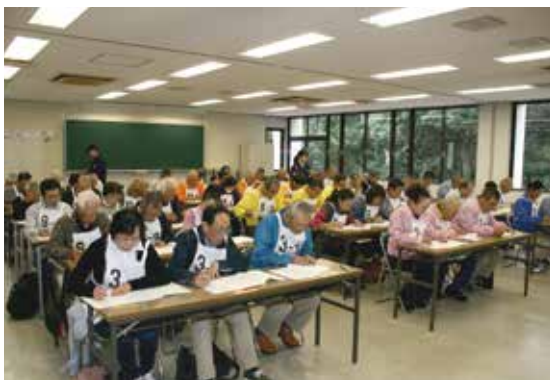
学科テストに取り組む選手の皆さん

10月13日(木)、県交通安全協会は、県・県警・千葉市・県自転車軽自動車商協同組合・千葉市交通安全協会の後援と県自動車練習所・県トラック協会・キリンビバレッジバリューベンダー株式会社の協賛を得て、「第7回千葉県交通安全高齢者自転車大会」を千葉市美浜区の花見川緑地交通公園にて開催しました。 大会には千葉中央、千葉東、千葉西、千葉南、習志野、船橋、松戸、松戸東、野田、柏、四街道、東金、市原、木更津の14協会14チーム56人が参加し、午前中は交通規則や標識に関する学科テスト、午後は園内のコースを走行する実技テストに臨みました。選手は合図を正確に行い、安全に走りながら、ピンの間を走り抜けるジグザグ走行やS字走行に懸命に取り組みました。