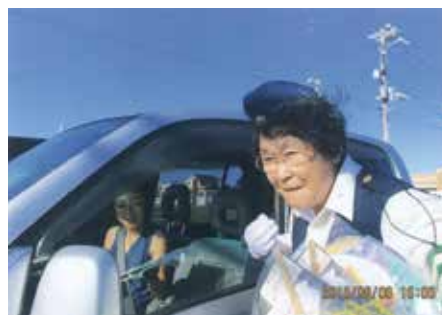
一宮 国道128号宮原交差点にて、啓発品を配布して交通安全を呼び掛けた。