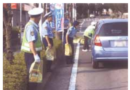
千葉南 おゆみ野地先交差点で飲酒運転追放キャンペーンを実施した。