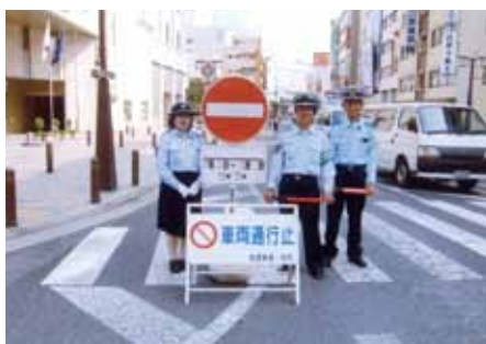
柏 JR柏駅東口で柏まつりの交通整理誘導活動を行った。