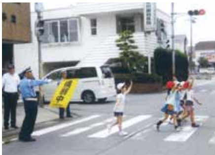
千葉北 山王小学校周辺で登下校時の交通整理誘導活動を実施した。