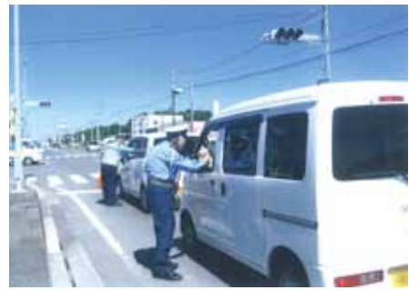
千倉 国道128号加茂地先で交通安全キャンペーンを実施した。