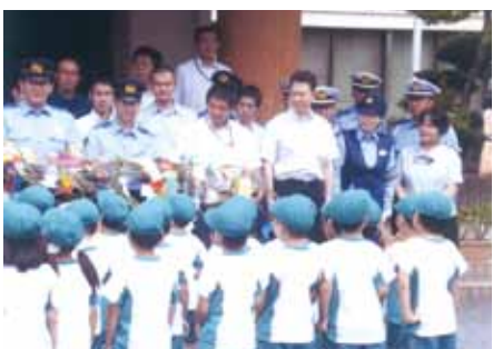
松戸東 幼稚園児が、七夕飾りに交通安全の願いを込めて松戸東警察署を訪問した。