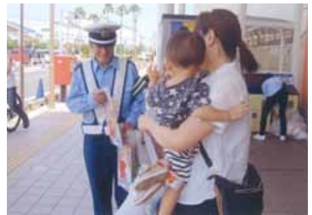
千葉中央 蘇我アリオの店頭で啓発品を手渡ししながら、交通事故防止キャンペーンを実施した。