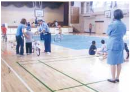
浦安 美浜南小学校で体験参加型自転車安全教室を行った。