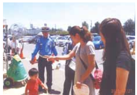
千葉東 物産店しよいか〜ごで啓発品を配布し交通安全を呼びかけた。