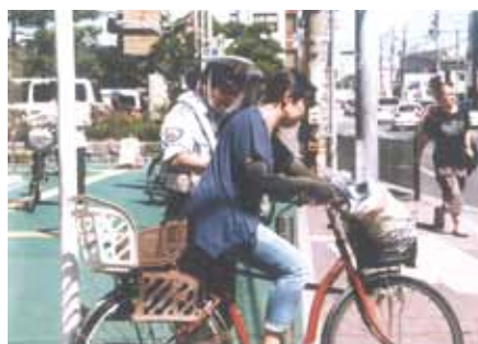
市川 市川市役所前で自転車安全の日啓発キャンペーンを実施した。