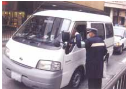
松戸 松戸駅東口交差点でゼブラ・ストップ活動を行った。