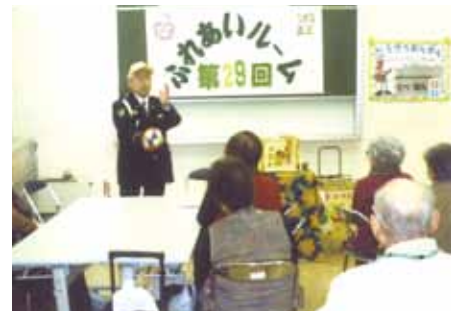
船橋東 高齢者を対象にマジックを活用した交通安全教室を開催した。