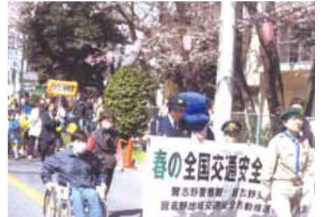
習志野 大久保東小学校前さくらまつりパレードで交通安全啓発活動を行った。