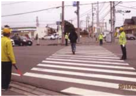
茂原 法目交差点でゼブラ・ストップ活動を行った。

交通安全協会の活動にご協力いただきありがとうございます。会員の皆様の会費は、地元の交通安全協会の交通安全協会ボランティア活動に活用されています。