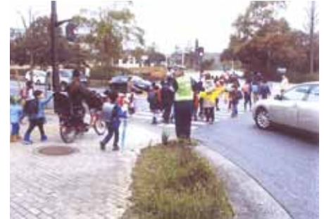
千葉南 緑区内主要交差点で新入学児童の交通事故防止活動を行った。