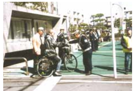
市川 市川市役所前で自転車安全の日啓発キャンペーンを行った。