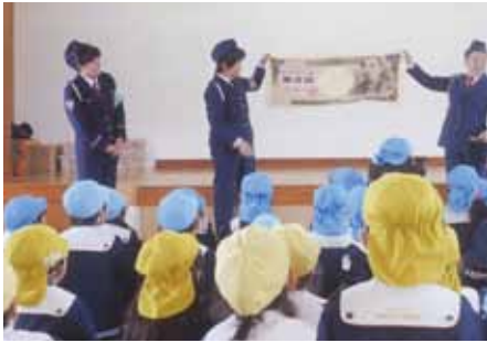
一宮 一宮保育所で交通安全教室を実施した。