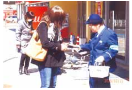
千葉東 ラ・パーク千城台店でチラシを配布し、事故防止を呼び掛けた。