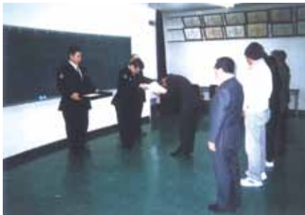
いすみ いすみ警察署で地区連名の表彰式を行った。