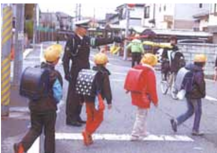
市原 辰巳台西小学校前でゼブラ・ストップ活動として交通安全誘導を行った。