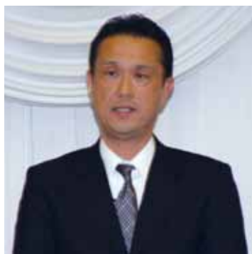
小島交通部参事官兼交通総務課長の挨拶

公益財団法人千葉県交通安全協会は3月24日、千葉市内ヴェルシオーネ若潮で、平成26年度定例理事会を開催しました。 会議に先立って、昨年10月に行われた「第5回千葉交通安全高齢者自転車大会」に協賛団体として多大な貢献のあった（一財）千葉県自動車練習所と（社）千葉県トラック協会に感謝状の贈呈が行われました。続いて昨年7月から10月まで各地区交通安全協会が実施した無事故・無違反運動（セーフティドライブ）に基づき2014年の表彰が行われ、今回優秀地区に選ばれた茂原交通安全協会、（一財）千倉交通安全協