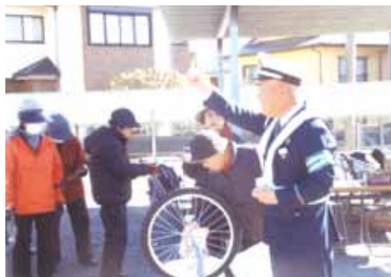
松戸東 中央ゲートボール場で自転車の交通安全教室を開催した。