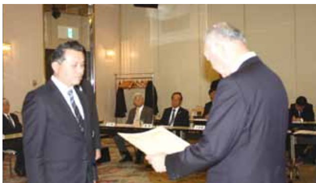
安藤会長から感謝状の贈呈

公益財団法人千葉県交通安全協会は3月24日、千葉市内ヴェルシオーネ若潮で、平成26年度定例理事会を開催しました。 会議に先立って、昨年10月に行われた「第5回千葉交通安全高齢者自転車大会」に協賛団体として多大な貢献のあった（一財）千葉県自動車練習所と（社）千葉県トラック協会に感謝状の贈呈が行われました。続いて昨年7月から10月まで各地区交通安全協会が実施した無事故・無違反運動（セーフティドライブ）に基づき2014年の表彰が行われ、今回優秀地区に選ばれた茂原交通安全協会、（一財）千倉交通安全協