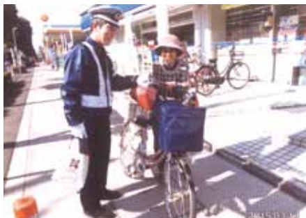
行徳 西友新浜店周辺で自転車安全利用キャンペーンを行った。