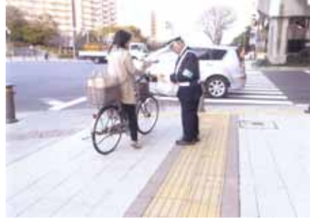
浦安 入船交差点で自転車交通安全キャンペーンを行った。