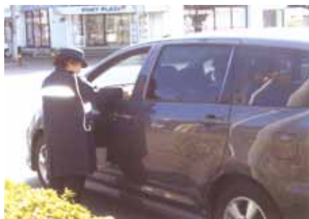
佐倉 市内交差点でアクション10に伴う街頭啓発活動を行った。